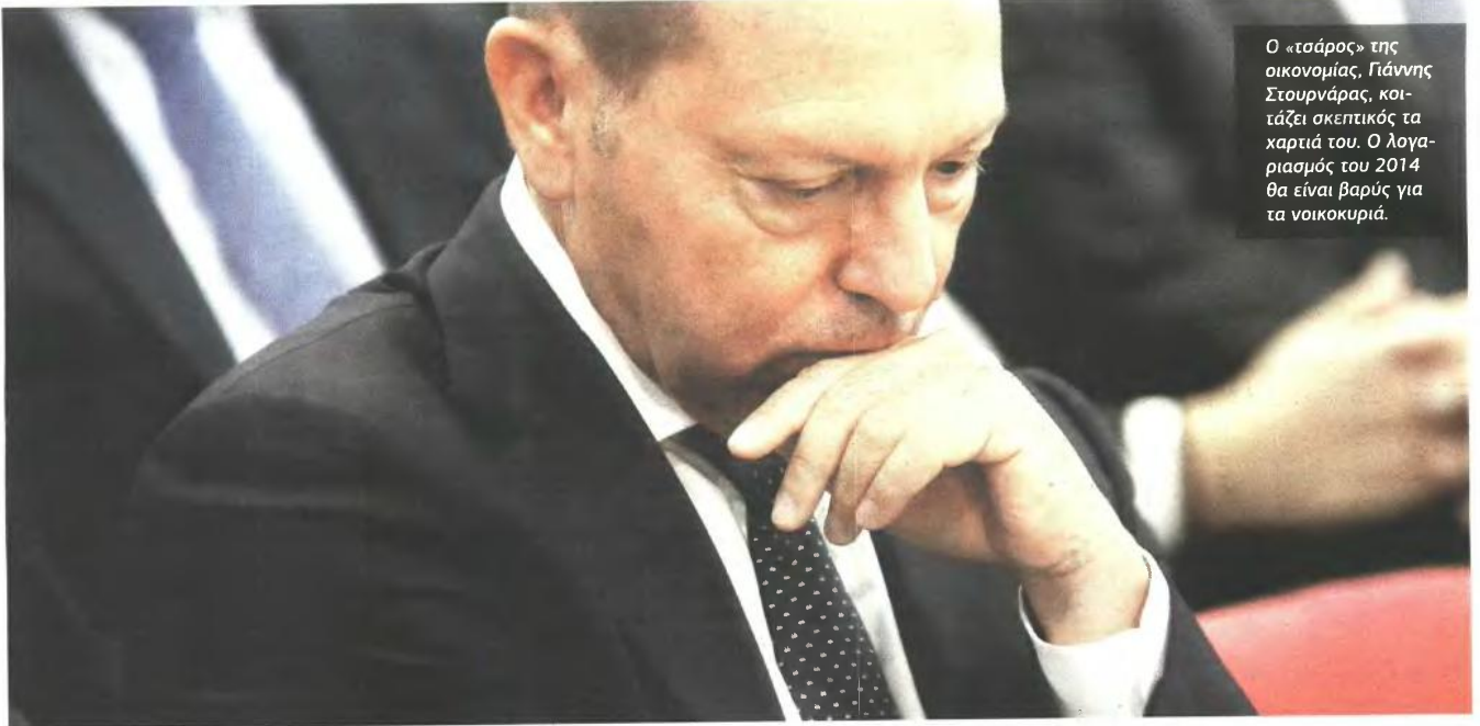
Ο «τσάρος» της οικονομίας, Γιάννης Στουρνάρας, κοιτάζει σκεπτικός τα χαρτιά του. Ο λογαριασμός του 2014 θα είναι βαρύς για τα νοικοκυριά.