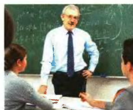
■ ■ ■ Αλλαγές προβλέπονται και για τους εκπαιδευτικούς που εργάζονται στα ιδιωτικά σχολεία

Αναφορικά με τις ώρες διδασκαλίας των διευθυντών γυμνασίων, λυκείων και επαγγελματικών scho-