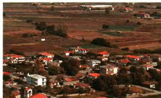
▲ ΣΥΜΦΩΝΑ με τη νομοθετική ρύθμιση, «για τα ακίνητα για τα οποία δεν υπάρχουν τιμές ζώνης στη δημοτική ενότητα, λαμβάνεται ο μέσος όρος των τιμών του δήμου»

Σε περίπτωση που στα αρχεία της ΔΕΗ τα τετραγωνικά μέτρα του ακινήτου είναι μηδέν, το ειδικό τέλος υπολογίζεται με βάση τα τετραγωνικά μέτρα που ελιφθήσαν υπόψη για τον υπολογισμό των δημοτικών τελών ή αν δεν υπολογίστηκαν δημοτικά τέλη, με βάση τα τετραγωνικά που ελιφθήσαν υπόψη για τον υπολογισμό του δημοτικού φόρου.