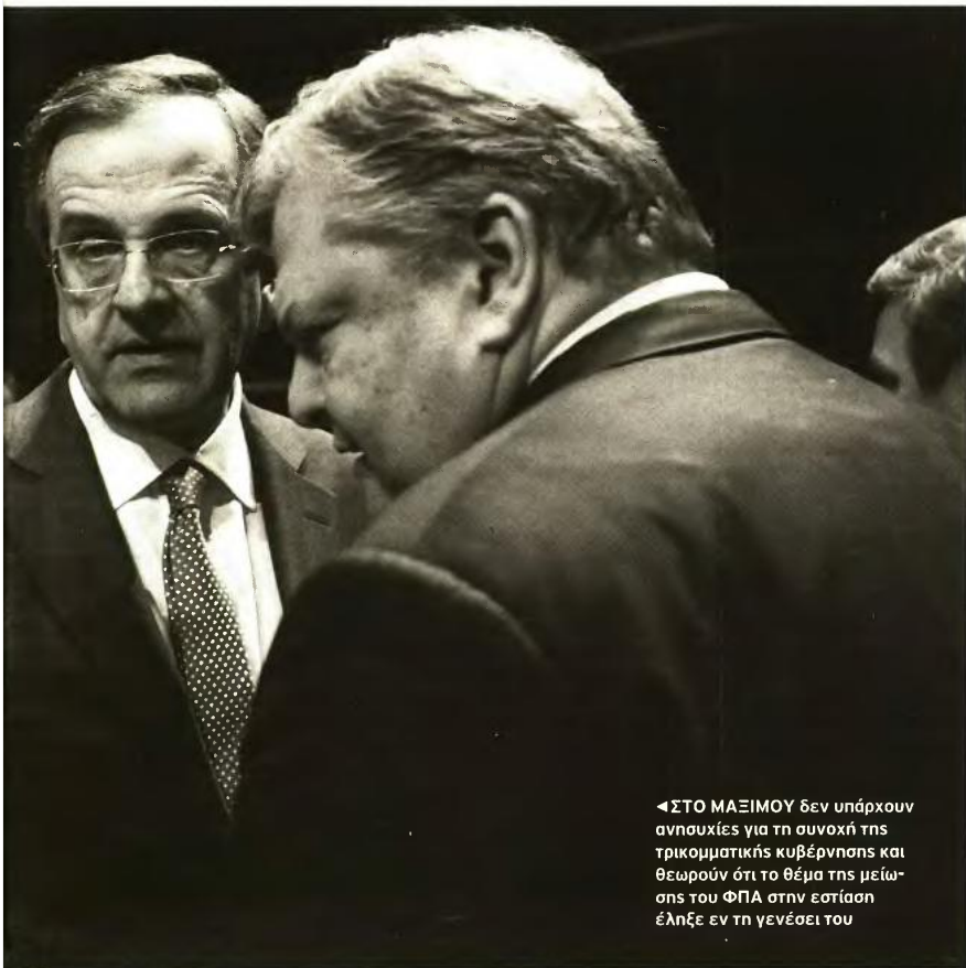
◀ ΣΤΟ ΜΑΞΙΜΟΥ δεν υπάρχουν ανησυχίες για τη συνοχή της τρικομματικής κυβέρνησης και θεωρούν ότι το θέμα της μείωσης του ΦΠΑ στην εστίαση έληξε εν τη γενέσει του