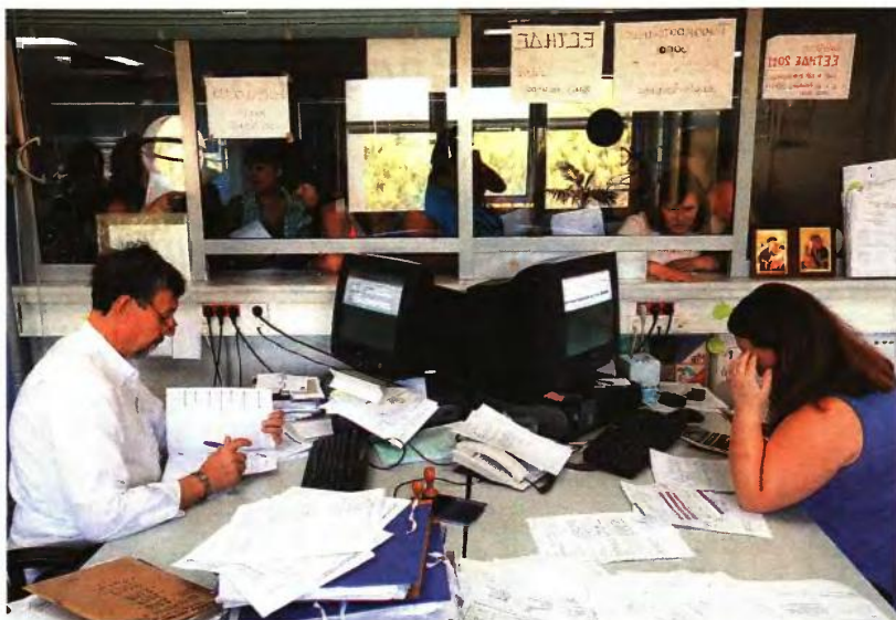
▲ ΣΕ 100 ΔΟΣΕΙΣ και με 50 ευρώ τον μήνα μπορούν να εξοφλούν οι φορολογούμενοι τα χρέη τους μέχρι και 5.000 ευρώ. Τα χρέη πάνω από 5.000 ευρώ θα εξοφλούνται σε 48 δόσεις με μείωση προσαυξήσεων έως 50%

■ Κεφαλαιοποιούνται οι πάσης φύσεως ληξιπρόθεσμες οφειλές συμπεριλαμβανομένων προσαυξήσεων και προστίμων μέχρι τις 31 Δεκεμβρίου 2012 και εξοφλούνται εφάπαξ ή σε ισόποσες μηνιαίες δόσεις με τις αντίστοιχες εκπτώσεις επί των προσαυξήσεων.