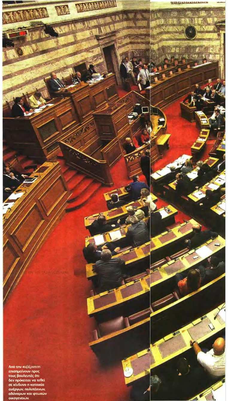
Από την κυβέρνηση επισπαιμούνται προς τους βουλευτές ότι δεν πρόκειται να τεθεί σε κίνδυνο η κατοικία ανέργων, πολιτέκνων, αδύναμων και φτωχών οικογενειών.

Με δήλωσή του, ο πρόεδρος της ΔΗΜ.ΑΡ. Φώτης Κουβέλης ζήτησε παράταση της απαγόρευσης τουλάχιστον έως το 2015, λέγοντας ότι «είναι απαράδεκτο, σε αυτές τις συνθήκες, να απειλείται και να βέλλεται το στοιχειώδες δικαίωμα του πολίτη στην κατοικία του», οι ΑΝ.ΕΛ. αναφέρουν ότι «οι τοποτηρητές του Μνημονίου μεθοδεύουν ξεπιάγμα των πλειστηριασμών α' κατοικίας, προκειμένου οι τράπεζες που διασώθηκαν με χρήματα των φορολογουμένων να βγάλουν στο αμύρ, αντί πινακίου φακής, χιλιάδες σπίτια του φτωχοποιημένου ελληνικού λαού», ενώ το ΚΚΕ χαρακτηρίζει «κοροϊδία» τους κυβερνητικούς ισχυρισμούς ότι θα προστατευτούν φτωχοί και αδύναμοι. ■