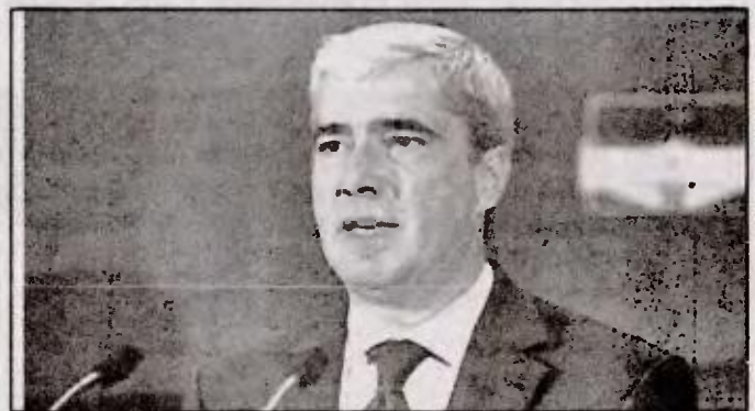
Ο κυβερνητικός εκπρόσωπος κ. Κεδίκογλου

Από την πλευρά του ΣΥΡΙΖΑ, ο γραμματέας της κοινοβουλευτικής ομάδας του κόμματος, Ν. Βούτσης, εκτιμά ότι αν προχωρήσουν οι κυβερνητικοί σχεδιασμοί για τους πλειστηριασμούς πρώτης κατοικίας η κυβέρνηση θα οδηγηθεί εκτός. «Εάν επιχειρήσει πράγματι να εφαρμόσει το σχέδιο των πλειστηριασμών της πρώτης κατοικίας η κυβέρνηση θα υποστεί πιθανά το 'πολιτικό ατύχημα' που απευχόταν...», ανέφερε μιλώντας στο ραδιοφωνικό σταθμό ΒΗΜΑ FM.