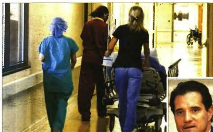
Στα ντ' όνιν του υπουργού Υγείας Α.δ. Γεωργιάδη η αύξηση του εισιτηρίου σε δημόσιο νοσοκομείο

Τον περασμένο Νοέμβριο το ενδεχόμενο πενταπλασιασμού του εν λόγω «χαρατσιού» είχε προκαλέσει τσουνάμι αντιδράσεων. Ιατρικοί σύλλογοι και ενώσεις νοσοκομειακών γιατρών μιλούσαν για «ασθενείς δύο ταχυτήτων, εκείνους που μπορούν να πληρώσουν και όσους αδυνατούν να αντεπεξέλθουν», ενώ η ηγεσία του υπουργείου Υγείας διαβεβαίωνε ότι το μέτρο θα εφαρμοστεί μόνο σε πε-