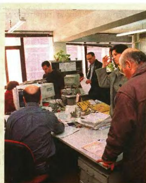
▶▶ ΤΟ ΤΡΙΜΗΝΟ ΙΑΝΟΥΑΡΙΟΥ-ΜΑΡΤΙΟΥ 2013