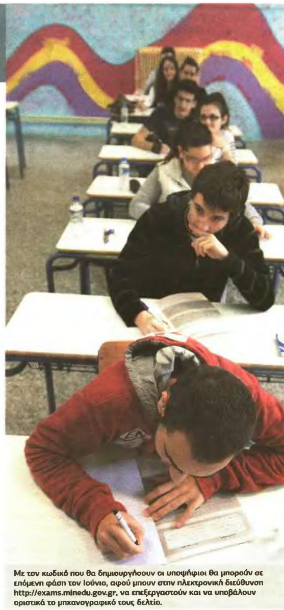
Με τον κωδικό που θα δημιουργήσουν οι υποψήφιοι θα μπορούν σε επόμενη φάση τον Ιούνιο, αφού μπου στην ηλεκτρονική διεύθυνση http://exams.minedu.gov.gr , να επεξεργαστούν και να υποβάλουν οριστικά το μηχανογραφικό τους δελτίο.

Τα παραπάνω δεν αφορούν στις ειδικές κατηγορίες των πολύτεκνων, των τρίτεκνων κ.λπ. για τις Στρατιωτικές και Αστυνομικές Σχολές και τις Σχολές Ακαδημιών Εμπορικού Ναυτικού, καθώς η διαδικασία και τα δικαιολογητικά γι' αυτές τις Σχολές καθορίζονται και ανακοινώνονται από τα αρμόδια υπουργεία. Την ίδια περίοδο μόνο όσοι συμμετάσχουν στις Πανελλαδικές Εξετάσεις των ΓΕΛ ή των ΕΠΑΛ, στο Λύκειό τους θα αποκτήσουν και το Δελτίο Εξεταζομένου, με το οποίο θα προσέρχονται στα εξεταστικά κέντρα τις ημέρες των εξετάσεων. ■