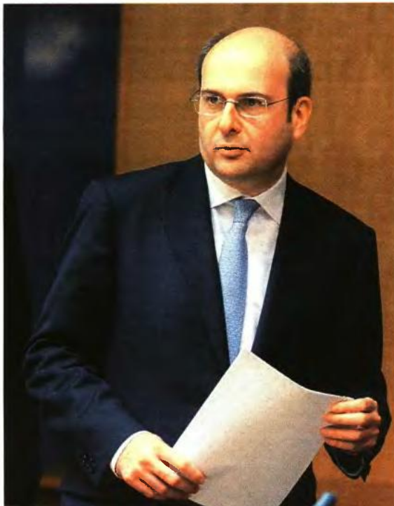
▲ ΤΙΣ ΔΙΑΤΑΞΕΙΣ του νομοσχεδίου θα παρουσιάσει εκτός απρόπουτου σήμερα ο υπουργός Ανάπτυξης Κωστής Χατζηδάκης