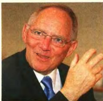
Σίγουρος για θετική έκθεση της τρόικας δηλώνει ο Βόλφγκανγκ Σόιμπλε

Η επίθεση φίλας και αναγνώρισης των προσαθειών που έχουν καταβληθεί και της προόδου που έχει σημειωθεί στην Ελλάδα συνεχίζεται από το Βερολίνο. «Βαθιά πεπεισμένος» ότι η έκθεση της τρόικας που θα παρουσιαστεί στο Ευρογκρουπ την Δευτέρα θα είναι θετική δήλωσε ο Β. Σόιμπλε, μπλέκοντας εγκώμιο στην κυβέρνηση Σαμαρά.