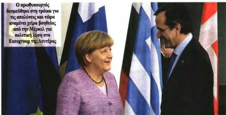
Ο πρωθυπουργός δεσμεύθηκε στη τρόικα για τις απαιτήσεις και τώρα αναμένει χείρα βοήθειας από την Μέρκελ για πολιτική λύση στο Ευρογκρουπ της Δευτέρας

Με βάση τη συμφωνία του πρωθυπουργού με την Τρόικα, οι συνολικά 14.000 υπάλληλοι θα προέρχονται: • Οι περίπου 7.500 από το υπουργείο