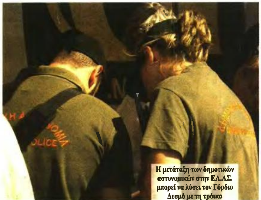
Η μετάταξη των δημοτικών αστυνομικών στην ΕΛ.ΑΣ. μπορεί να λύσει τον Γόρδιο Δεσμό με τη τρόικα

Θα αναλάβουν γραφειοκρατικές δουλειές στα τμήματα και θα απελευθερωθούν οι μάχημοι αστυνομικοί