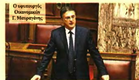
Ο υπουργός Οικονομικών Γ. Μανραγάκης

• Οι αποζημιώσεις απόλυσης παραμένουν αφορολόγητες εφόσον δεν ξεπερνούν τις 60.000 ευρώ και από εκεί και πάνω επιβάλλεται φορολογία με συντελεστές 10%, 25% και 30% ανάλογα το ύψος της αποζημίωσης.