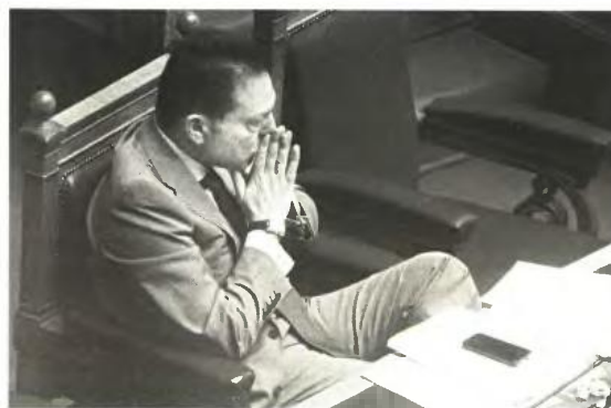
Μετά από έξι χρόνια ύφεσης ο Γ. Στουρνάρας εύχεται και... προσεύχεται το 2014 κάτι ν' αλλιάξει

του Ευρωσυστήματος από τη διακράτηση ομολόγων του ελληνικού Δημοσίου. Τα έσοδα αυτά όμως δεν «μετρούν», δηλαδή δεν λαμβάνονται υπόψη στην αξιολόγηση