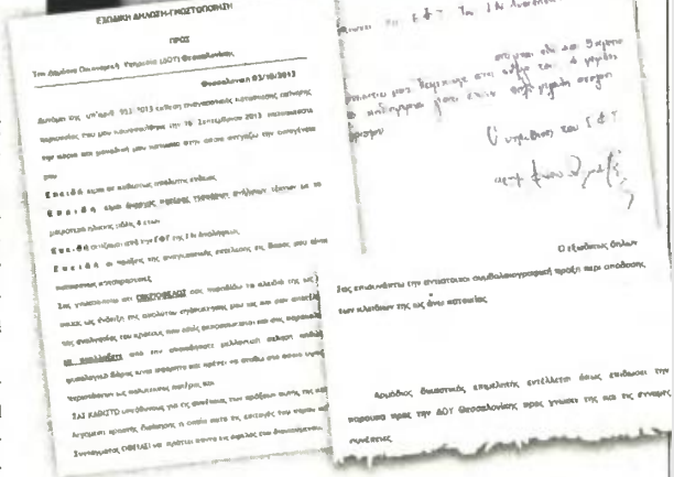
Η εξώδικη διαμαρτυρία του 39χρονου άνεργου πολύτεκνου στον υπουργό Οικονομικών Γιάννη Στουρνάρα και η βεβαίωση του Ι.Ν. Ανάλυσης του Κυρίου ότι σιτίζεται στο σνοσίτιο του ναού