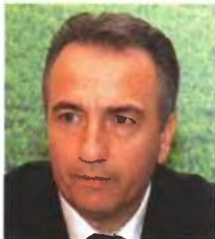
Σταύρος Καλαφάτης, αναπληρωτής υπουργός ΠΕΚΑ.