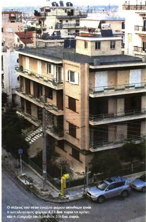
Ο στόχος του νέου ενιαίου φόρου ακινήτων είναι ο καταλογισμός φόρων 4,15 δισ. ευρώ το χρόνο και η είσπραξη τουλάχιστον 2,9 δισ. ευρώ.

Δεν πρέπει να υπάρχουν ληξιπρόθεσμα προς το Δημόσιο. Στο μικροσκόπιο η περιουσία και οι καταθέσεις