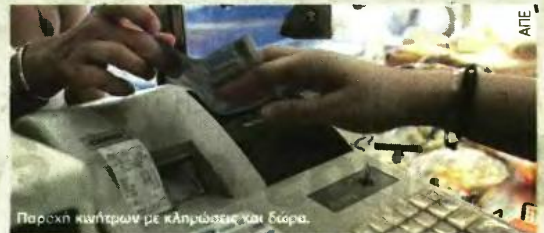
Παροχή κινήτρων με κλήρωση και δώρα.

ΣΗΜΑΝΤΙΚΕΣ αλλαγές στις διατάξεις για τα κίνητρα συλλογής αποδείξεων περιλαμβάνονται στο νέο φορολογικό νομοσχέδιο που έχουν ήδη καταρτίσει το υπουργείο Οικονομικών και η τρικόκα και αναμένεται να τεθεί σε δημόσια διαβούλευση εντός των προσεχών ημερών. Σύμφωνα με πληροφορίες, το νέο σύστημα συλλογής αποδείξεων που θα εφαρμοστεί από το επόμενο έτος θα προβλέπει τα εξής: