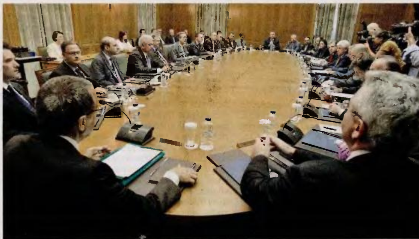
Ενημέρωση ζήτησε ο πρωθυπουργός χθες από τους υπουργούς του για την πορεία των υποχρεώσεων που έχει αναλάβει ο καθένας.

Η προετοιμασία της διαπραγμάτευσης με τους εκπροσώπους των πιστωτών μας είναι μόνο μία από τις δύσκολες εξισώσεις που πρέπει να λύσει ο κ. Σαμαράς. Εξαιρετικά κρίσιμη αποδεικνύεται και η εξεύρεση μιας λύσης η οποία θα διατηρήσει άθικτη τη συνοχή της κυβέρνησης, σχετικά με τους πλειστηριασμούς κατοικιών. Χθες και ο κυβερνητικός εκπρόσωπος Σίμος