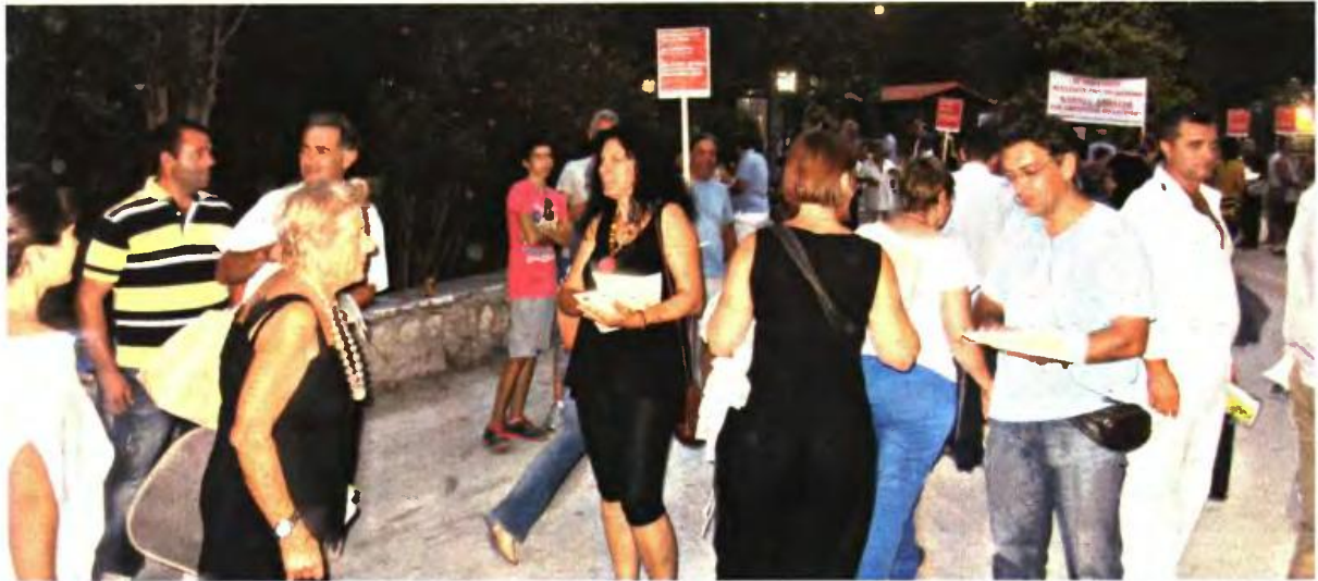
Πώς μπορεί να μειωθεί το προσωπικό σε ένα υποστελεχωμένο υπουργείο;

Οι υπάλληλοι του υπουργείου Πολιτισμού - Αθλητισμού