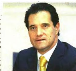
«Θα προστατέψουμε τους φτωχούς», δήλωσε χθες ο υπ. Υγείας Αδωνις Γεωργιάδης.

πρόταση που θα παρουσιάσει το οικονομικό επιτελείο. Αντιδράσεις έχουν εκφράσει ήδη βουλευτές της Ν.Δ. και του ΠΑΣΟΚ, ενώ ο ΣΥΡΙΖΑ θα κρατήσει σταθερά ψηλά τους αναπολιτευτικούς τόνους. «Απέναντι» είναι και η ΔΗΜ.ΑΡ. η οποία ζητεί η απαγόρευση να πλειστηριασμών να ισχύει και το 2015. Πάντως οι Κοινοβουλευτικές Ομάδες της Ν.Δ. και του ΠΑΣΟΚ «ερμήνευσαν» τις σχετικές δηλώσεις των υπουργών ως απόφαση της κυβέρνησης να προχωρήσει στην άρση της απαγόρευσης παρά, όπως έλεγαν, τους καθυποτακτικούς τόνους.