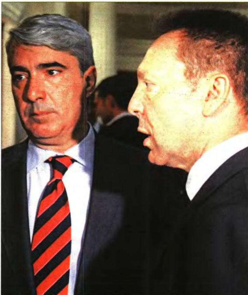
Ο κυβερνητικός εκπρόσωπος Σίμος Κεδίκογλου με τον υπουργό Οικονομικών Γ. Στουρνάρα στο Μέγαρο Μαξίμου, σε παλαιότερη φωτο

Από την πλευρά του ΠΑΣΟΚ, την καταψήφισαν οι «ξεπαγώματος» των πλειστηριασμών είχαν προαναγγείλει βουλευτές όπως ο Πάρις Κουκουλόπουλος και η Θεοδώρα Τζάκρη. Εκ των πραγμάτων, όλοι αυτοί οι βουλευτές βρίσκονται τώρα ενώπιον σοβαρού διλήμματος.