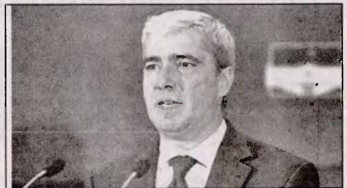
Ο κυβερνητικός εκπρόσωπος κ. Κεδίκογλου

Από την πλευρά του ΣΥΡΙΖΑ, ο γραμματέας της κοινοβουλευτικής ομάδας του κόμματος, Ν. Βούτσης, εκτιμά ότι αν προχωρήσουν οι κυβερνητικοί σχεδιασμοί για τους πλειστηριασμούς πρώτης κατοικίας η κυβέρνηση θα οδηγηθεί εκτός. «Εάν επιχειρήσει πράγματι να εφαρμόσει το σχέδιο των πλειστηριασμών της πρώτης κατοικίας η κυβέρνηση θα υποστεί πιθανά το 'πολιτικό ατύχημα' που απευχόταν...», ανέφερε μιλώντας στο ραδιοφωνικό σταθμό ΒΗΜΑ FM.