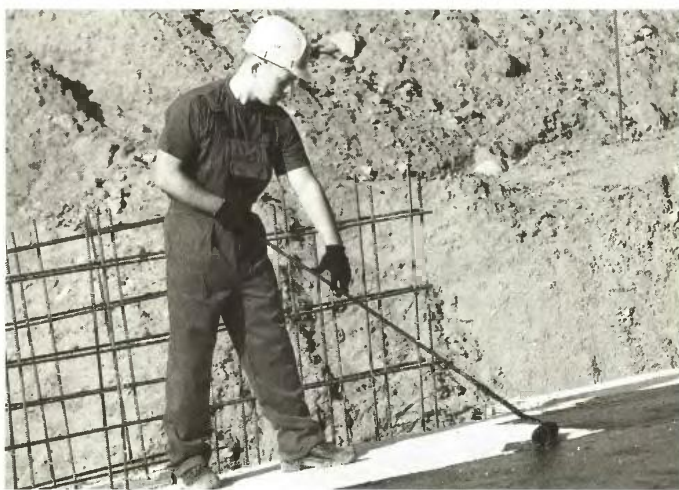
Δήμιο προκηρύξεων για οδηγούς, τεχνίτες και εργάτες θα είναι Μάιος και Ιούνιος στους δήμους

Επομένως, αμέσως μόλις το σχέδιο ΚΥΑ διαβιβαστεί στο υπουργείο Διοικητικής Μεταρρύθμισης και Ηλεκτρονικής Διακυβέρνησης για συνυπογραφή και μετά την ολοκλήρωση της διαδικασίας έκδοσης της απόφασης