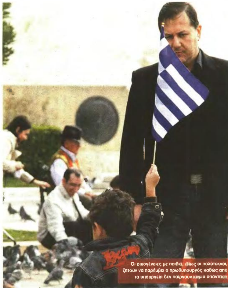
Οι οικογένειες με παιδιά, ιδίως οι πολύτεκνοι, ζητούν να παρέμβει ο πρωθυπουργός καθώς από τα υπουργεία δεν παίρνουν καμία απάντηση