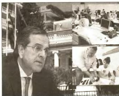
■ Η κυβέρνηση, προετοιμάζεται ώστε να είναι έτοιμη για τις νέες διαπραγματεύσεις

Όπως επιστημαίνεται από το υπουργείο, όλη η διαδικασία τελεί υπό τον έλεγχο και την εποπτεία του ΑΣΕΠ, το οποίο έχει αναλάβει τη μοριοδότηση των υπαλλήλων, στη βάση αντικειμενικών κριτηρίων που το υπουργείο Διοικητικής Μεταρρύθμισης υιοθέτησε τόσο για την ένταξή τους σε καθεστώς διαθεσιμότητας όσο και για την επαναποθέτησή τους.