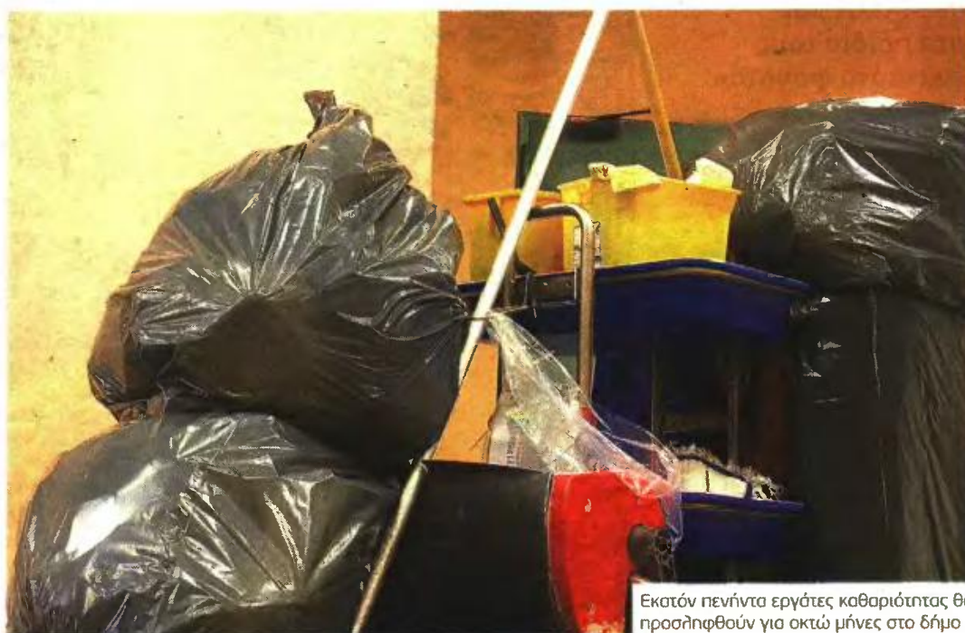
Εκατόν πενήντα εργάτες καθαριότητας θα προσληφθούν για οκτώ μήνες στο δήμο

Ενισχύεται η Υπηρεσία Καθαριότητας του δήμου με οδηγούς, χειριστές μηχανημάτων και εργάτες καθαριότητας