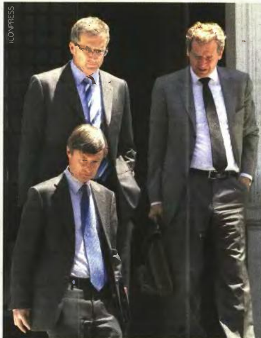
Η τρόικα έχει καταστήσει σαφές ότι επιθυμεί να βγαίνουν στο σφυρί όλα τα ακίνητα από τις τράπεζες, όταν οι δανειολήπτες δεν τα αποπληρώνουν.

Είναι οι κατηγορίες δανειοληπτών που το οικονομικό επιτελείο θέλει πρωτίστως να διασφαλίσει, όπως έγινε και με το νόμο για τη ρύθμιση των ενήμερων ενυπόθηκων δανείων. ■