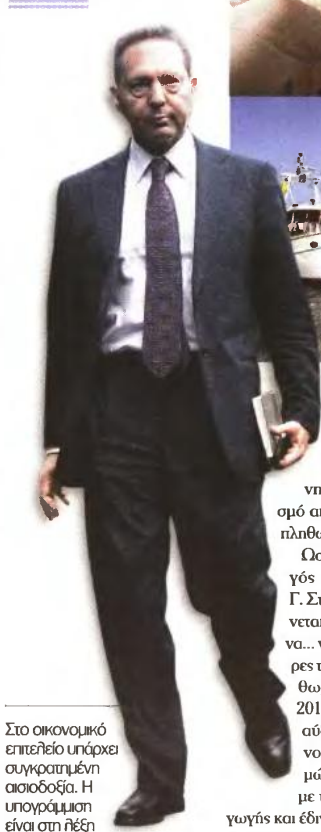
Στο οικονομικό επιτελείο υπάρχει συγκρατημένη αισιοδοξία. Η υπογράμμιση είναι στη θέση «συγκρατημένη»...

Το ΔΝΤ θεωρεί πως ένα σημαντικό μέρος της μείωσης του μοναδιαίου κόστους εργασίας οφείλεται στην εκτίναξη της ανεργίας και όχι στη μείωση των μισθών!