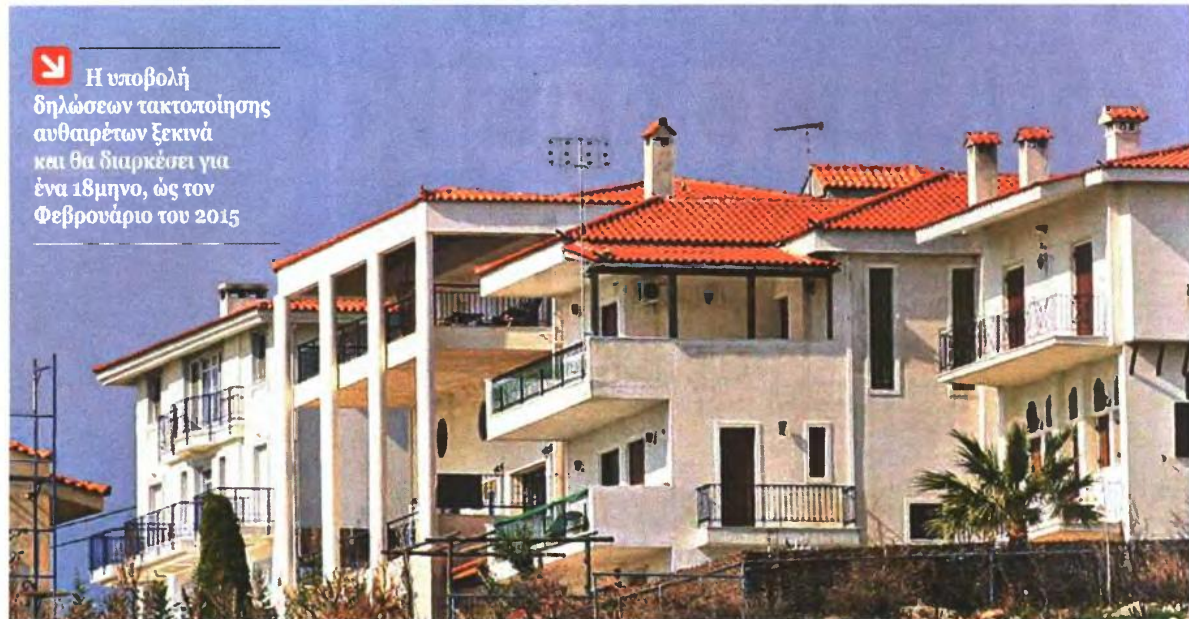
Η υποβολή δηλώσεων τακτοποίησης αυθαιρέτων ξεκινά και θα διαρκέσει για ένα 18μηνο, ως τον Φεβρουάριο του 2015

Α πό τις 2 Σεπτεμβρίου ξεκινά η υποβολή δηλώσεων τακτοποίησης αυθαιρέτων, που θα διαρκέσει για ένα 18μηνο, ως τον Φεβρουάριο του 2015. Ο νέος νόμος 4178/2013, που προωθήθηκε με διαδικασίες fast track και μέσα στην καλοκαιρινή ραστώνη, έχει αρκετά σημεία που χρειάζονται... μετάφραση. Ειδικά το άρθρο 23 με τον υπότιτλο «ειδικές διατάξεις» έχει προβλέψεις προσωρινής ή και πλήρους τακτοποίησης για κάθε «πενεμένη ιστορία», από βίλες-αυαφυκτήρια έως αυθαιρέτα σε οικολογικά ευαίσθητες περιοχές, που σύμφωνα με το άρθρο 2 του ίδιου νόμου δεν εντάσσονται στις ρυθμίσεις! Υπάρχουν όμως σημαντικά ζητήματα που καλό είναι να γνωρίζει κάθε ενδιαφερόμενος πριν καταφύγει σε μηχανικό που θα αναλάβει όλες τις διαδικασίες.