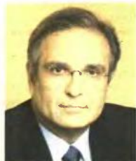
Ο Γιάννης Παπαϊωάννου, υπουργός Οικονομικών το 2009, αποφάσισε το πρώτο πάγωμα των πλειστηριασμών.

Στην περίπτωση που ο οφειλέτης δεν έχει τη δυνατότητα να καταβάλει κανένα ποσό ή μπορεί να καταβάλει ελάχιστα για την εξόφληση των χρεών, το δικαστήριο ορίζει πολύ μικρό ποσό για καταβολή στους πιστωτές αν το εισόδημα ή ο οικονομική κατάσταση του οφειλέτη δεν επιτρέπει μόνον μεγαλύτερο. Μπορεί όμως ακόμη να απαλλάξει τον