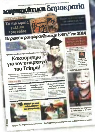
Το χθεσινό πρωτοσέλιδο της «κυριακάτικης δημοκρατίας»