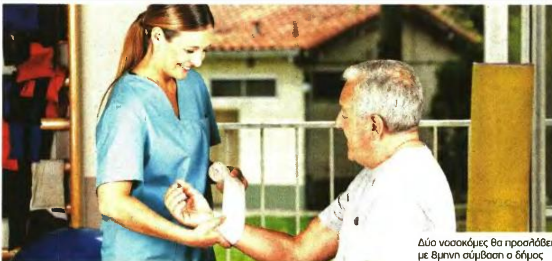
Δύο νοσοκόμες θα προσλάβει με 8μηνη σύμβαση ο δήμος