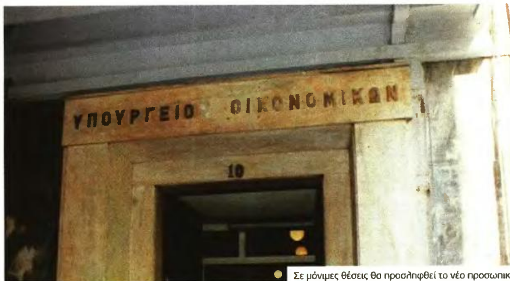
Σε μόνιμες θέσεις θα προσληφθεί το νέο προσωπικό