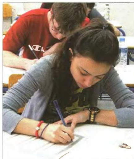
Όπως όλα δείχνουν, οι φετινές πανελλαδικές θα γίνουν υπό αντίξοες συνθήκες

Όμως τελικά η πιο μεγάλη ώρα είναι αυτή της εξέτασης. «Είναι η ώρα που ο υποψήφιος με αυτοπεποίθηση πρέπει να δώσει τον καλύτερο εαυτό του χωρίς πανικό, άγχος και φόβο» αναφέρει ο φιλόλογος. Σύμφωνα με τον ίδιο, η προσεκτική ανάγνωση των θεμάτων είναι το κλειδί της επιτυχίας, προκειμένου να κατανοήσει ο μαθητής σε τι ακριβώς του ζητείται να απαντήσει. «Δυστυχώς, δεν είναι λίγες