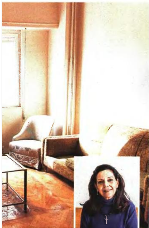
Η τα μνηνιάια έξοδα,

και τα κομοδίνα», λέει οι εθελόντριες με ενθουσιασμό. «Θεωρώ τυχερό τον εαυτό μου που έμαθα ότι όλο αυτό γίνεται εδώ. Πρέπει ο κόσμος να σηκωθεί από τους καναπέδες για να ήσουμε τα προβλήματα», λέει ο ιδιοκτήτης της μεταφορικής.