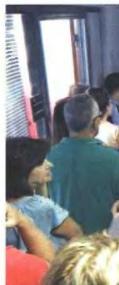
Ουρές πολιτών σε υπηρεσία

β) Ο εργαζόμενος να παρέχει υπηρεσίες μέχρι και σε τρεις εργοδότες, φυσικά ή νομικά πρόσωπα, ή σε περισσότερους από τρεις εργοδότες, φυσικά ή νομικά πρόσωπα, εφόσον στην περίπτωση αυτή το 75% των ακαθάριστων εσόδων που προέρχεται μόνο από έναν εκ των εργοδοτών αυτών. Για όσους αμειβονται με μπλοκάκια από το εισόδημά τους, εκτός από τις ασφαλιστικές εισφορές που αφαιρούνται, δεν δύναται να εκπέσει καμία δαπάνη.