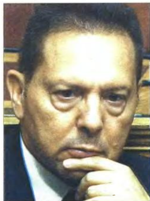
Ο υπ. Οικονομικών Γιάννης Στουφάρας

προσχεδίου του Προϋπολογισμού του 2014 ότι τα έσοδα από άμεσους φόρους θα αυξηθούν το επόμενο έτος κατά 2,163 δις. ευρώ υποκρύπτει τη νέα φορολογική αφαιμαξη που σχεδιάζεται κατά των μισθωτών, των συνταξιούχων, των αυτοαπασχολούμενων, των αγροτών και των επιχειρήσεων με την εφαρμογή του νέου επαχθούς καθεστώτος αυτοτελούς φορολόγησης κάθε πηγής εισοδήματος, το οποίο προβλέπει ο φορολογικός νόμος 4110/2013. Το νέο αυτό καθεστώς φορολόγησης προβλέπει: