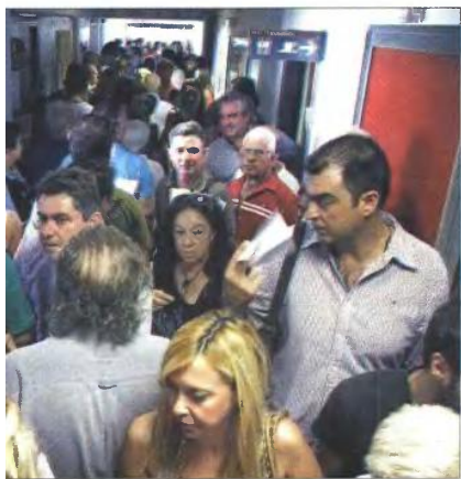
α της εφορίας

■ από τις περικοπές λειτουργικών δαπανών στους τομείς της υγείας, της παιδείας, της εθνικής άμυνας, της Τοπικής Αυτοδιοίκησης και από τη μείωση των επιχορηγήσεων σε φορείς άμεσα εποπτευόμενους από το Δημόσιο.