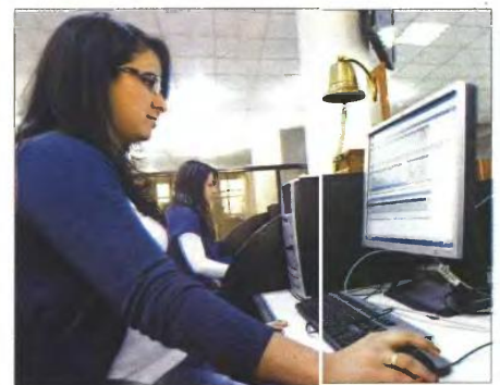
Υπάλληλος σε υπηρεσία της Εφορίας

Μόνο τρία θα είναι τα κλιμάκια ενώ θα υπάρξει πέναλτι για όσους δεν συγκεντρώσουν τις αποδείξεις