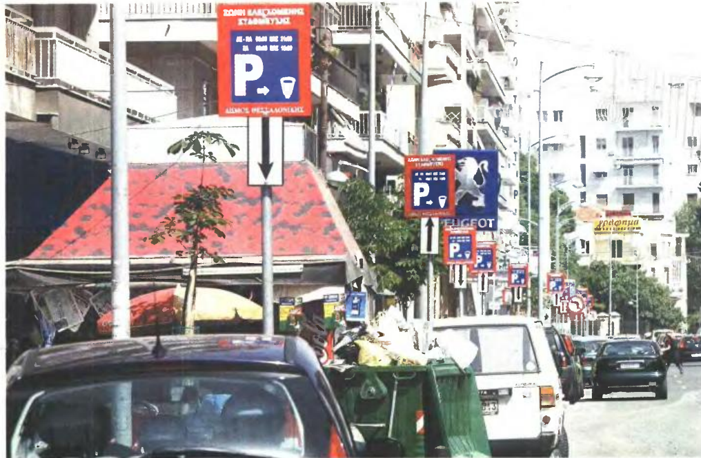
«Παγωμένα» στο ύψος των 1,70 ευρώ ανά ώρα θα παραμείνουν τα τέλη στάθμευσης και μέσα στο 2014.

1 μέχρι και το 95 και από τον αριθμό 4 μέχρι και το 26