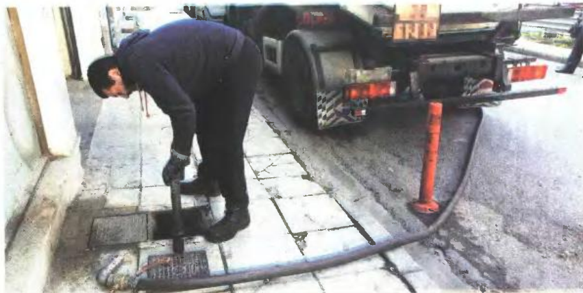
Εισοσώσεις από 52,50 έως 1.050 ευρώ θα λάβουν όσα νοικοκυριά προμηθευτούν φέτος πετρέλαιο θέρμανσης.

ευρώ την 1η-1-2011. Το ισχύον, κατά περίπτωση, εισοδηματικό όριο θα προσαυξάνεται κατά 3.000 ευρώ για κάθε προστατευόμενο τέκνο. Σε κάθε περίπτωση, για τη χορήγηση του επιδόματος θα λαμβάνεται υπόψη το συνολικό οικογενειακό εισόδημα κάθε νοικοκυριού, στο οποίο θα συμπεριλαμβάνονται και τα αυτοτελώς φορολογούμενα και φοροαπαλλαγμένα ποσά, όπως τα επιδόματα τριτέκνων και πολυτέκνων,