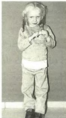
Το κορίτσι είχε κανονικά (!) χαρτιά από το Ληξιαρχείο Αθηνών

Την ψυχολογική στήριξη του παιδιού έχει αναλάβει ο ψυχολόγος της Γενικής Αστυνομικής Διεύθυνσης Περιφέρειας Θεσσαλίας. Επίσης, έπειτα από αίτημα της Υποδιεύθυνσης Ασφάλειας Λάρισας, εκδόθηκε διάταξη από την Εισαγγελία Πλημμελειοδικών Λάρισας, με την οποία αφαιρέθηκε προσωρινά η επιμέλεια της ανήλικης από τους δύο Ρομά και το κορίτσι παραδόθηκε στο «Χαμόγελο του Παιδιού»