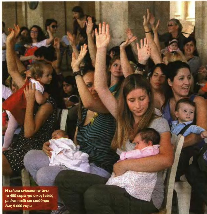
Η ετήσια ενίσχυση φτάνει τα 480 ευρώ για οικογένειες με ένα παιδί και εισόδημα έως 9.000 ευρώ