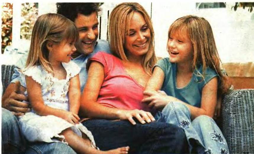
▲ ΟΙ ΟΙΚΟΓΕΝΕΙΕΣ που δικαιούνται το επίδομα τέκνων θα λάβουν σε μία δόση τα χρήματα του πρώτου και του δεύτερου τριμήνου και κατόπιν θα ακολουθήσουν άλλες δύο δόσεις

προϋποθέσεις για τη χορήγηση του επιδόματος και τα απαιτούμενα δικαιολογητικά. Με βάση τον σχεδιασμό, σε μία δόση θα καταβληθούν τα χρήματα του πρώτου και δεύτερου τριμήνου, ενώ θα ακολουθήσουν στη συνέχεια άλλες δύο δόσεις. Σύμφωνα με τους πίνακες που έχει επεξεργαστεί ο ΟΓΑ, η ετήσια ενίσχυση φτάνει τα 480 ευρώ για οικογένειες με ένα παιδί ενώ το καταβαλλόμενο ποσό αυξάνεται ανάλογα με τον αριθμό των τέκνων. Για παράδειγμα, οικογένεια με τρία παιδιά και χαμηλό εισόδημα θα πάρει ετήσια ενίσχυση 2.900 ευρώ (δίνεται επίδομα