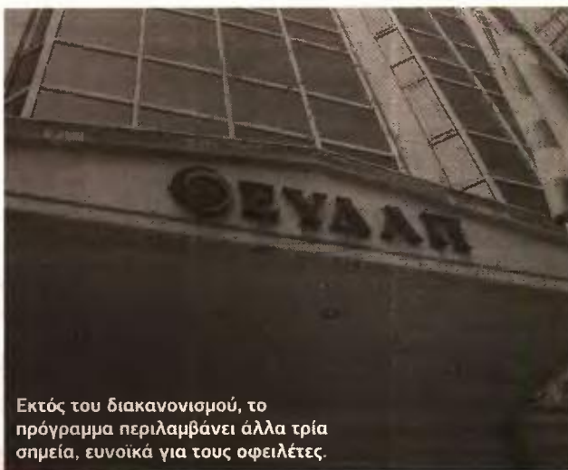
Εκτός του διακανονισμού, το πρόγραμμα περιλαμβάνει άλλα τρία σημεία, ευνοϊκά για τους οφειλέτες.

ΕΥΝΟΪΚΟΤΕΡΟ ΠΡΟΓΡΑΜΜΑ ΔΙΑΚΑΝΟΝΙΣΜΩΝ ΓΙΑ ΠΕΛΑΤΕΣ ΜΕ ΑΠΟΔΕΔΕΙΓΜΕΝΗ ΟΙΚΟΝΟΜΙΚΗ ΔΥΣΚΟΛΙΑ