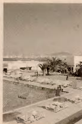
Το πρόγραμμα «Τουρισμός για Όλους 2013 - 2014», είναι συνολικής δαπάνης 5 εκατ. ευρώ.

Στο μεταξύ διευθυντικά στελέχη της ATOUT France, επίσημου φορέα τουρισμού της Γαλλίας, συναντήθηκαν στην Αθήνα με στελέχη του υπ. Τουρισμού, του ΕΟΤ, του ΞΕΕ, της Invest in Greece και του ΣΕΤΕ, συζητώντας θέματα που μεταξύ άλλων σχετίζονται με τις πολιτικές υλοποιήσεις μεγάλων σχεδίων τουριστικών ανάπτυξης.