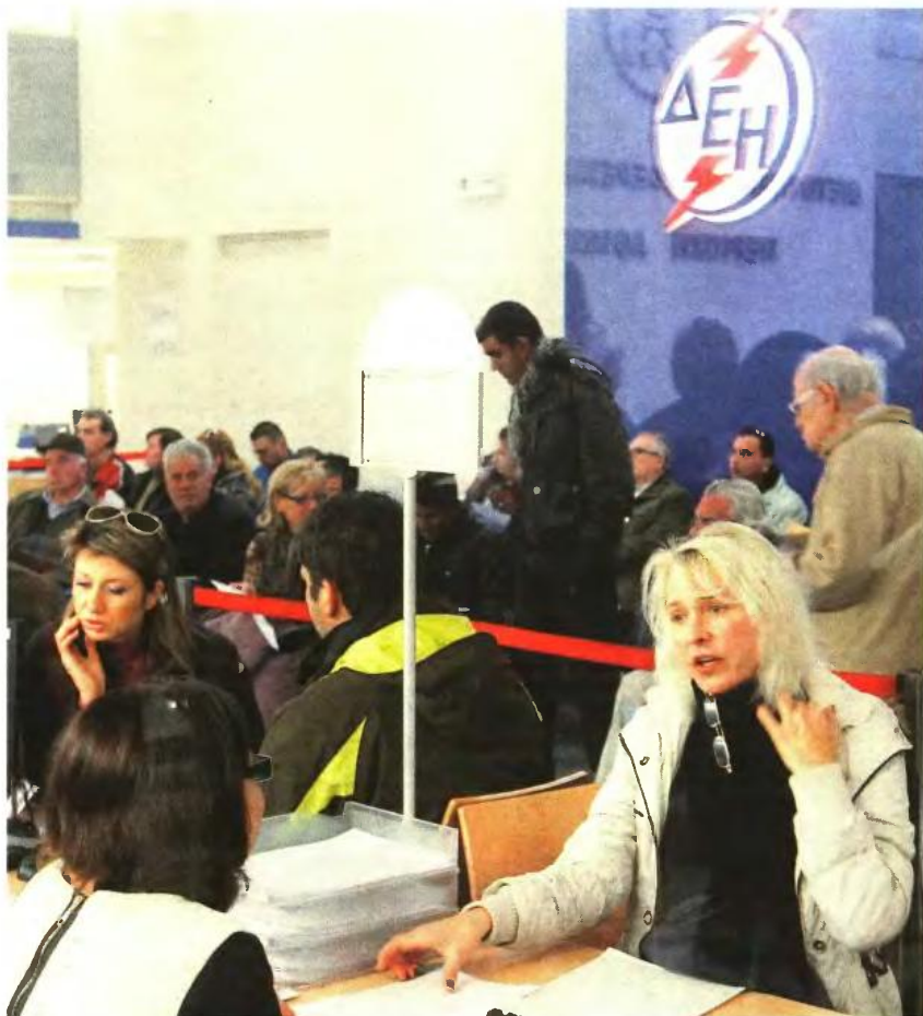
▲ ΠΕΡΑ ΑΠΟ ΤΗΝ ΚΑΤΑΝΑΛΩΣΗ ρεύματος που πληρώνουμε στη ΔΕΗ, στους λογαριασμούς περιλαμβάνονται και χρεώσεις υπέρ τρίτων, οι οποίες υποχρεωτικά εισπράττονται από τη ΔΕΗ με βάσει σχετικών νόμων

ΛΕΙΑΣ (ΥΚΩ): Ως ΥΚΩ έχουν χαρακτηριστεί, σύμφωνα με σχετικές Υπουργικές Αποφάσεις (ΦΕΚ Β' 1040/07 και ΦΕΚ Β' 1614/2010) οι υπηρεσίες: