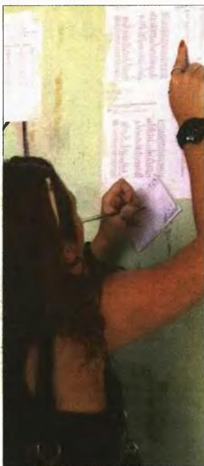
Μαθήτρια κοιτάζει τους πίνακες με τα αποτελέσματα από τις πανελλαδικές εξετάσεις