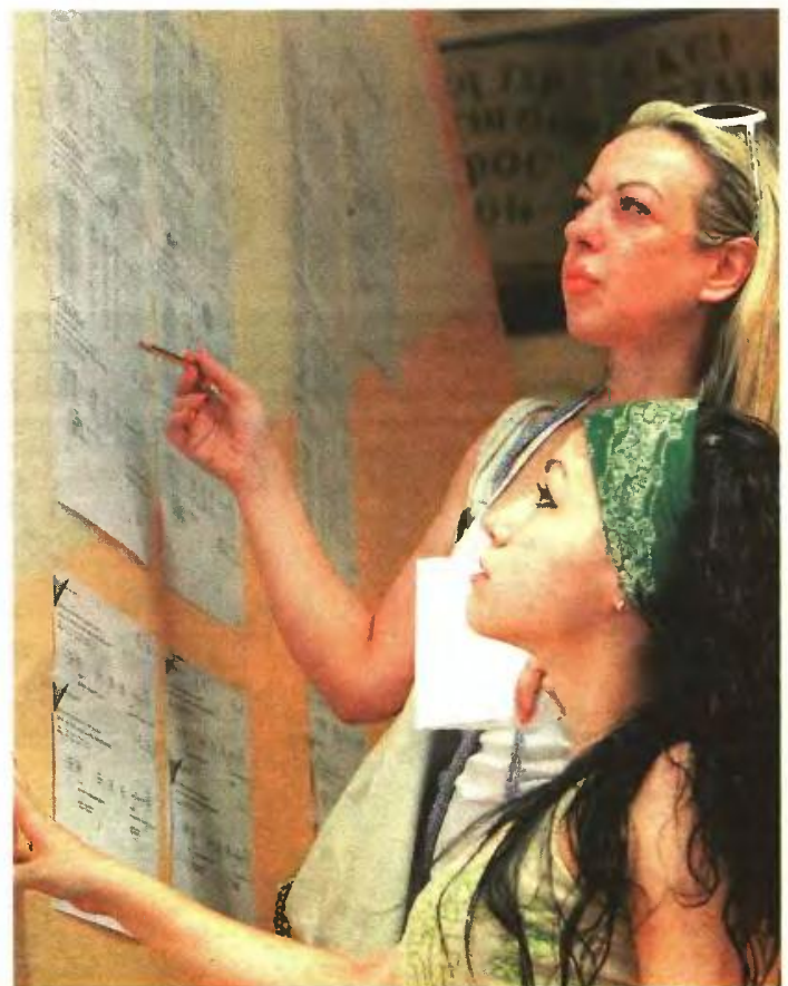
▲ ΜΕΤΑ ΤΗ ΜΙΑ το μεσημέρι θα αναρτηθούν στα Λύκεια οι βαθμοί των υποψηφίων. Την ίδια ώρα θα «ανέβουν» και στην ιστοσελίδα results.minedu.gov.gr

Στα πανεπιστήμια, ο αριθμός των εισακτέων σε σχέση με το προηγούμενο έτος είναι αυξημένος κατά 2.113 θέσεις, ενώ στα ΤΕΙ θα εισαχθούν 8.919 λιγότεροι.