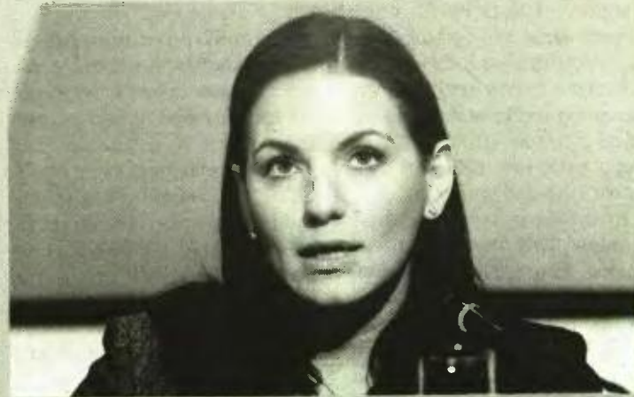
Η υπουργός Τουρισμού κυρία Ολγα Κεφαλογιάννη

και τις τοπικές οικονομίες» δήλωσε η κυρία Κεφαλογιάννη και κατέληξε τονίζοντας «ότι ο τουρισμός σε αυτή την κρίσιμη συγκυρία για τη χώρα, μπορεί και πρέπει να παίξει τον ρόλο της ατμομηχανής που θα οδηγήσει την εθνική οικονομία στον δρόμο της ανάπτυξης».