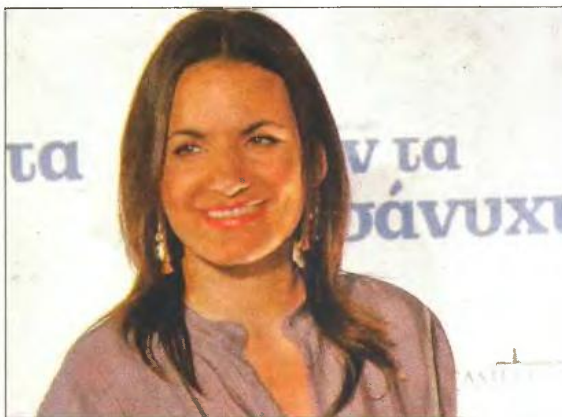
«Το πρόγραμμα Τουρισμός για Όλους για την περίοδο 2013 - 2014 απευθύνεται στις οικονομικά ασθενέστερες κοινωνικές ομάδες», σημείωσε η υπουργός Τουρισμού Όλγα Κεφαλογιάννη

Σε ό,τι αφορά τα εισοδηματικά κριτήρια υπαγωγής στο πρόγραμμα, αυτά διαμορφώνονται ως εξής: σε 16.000 ευρώ για μεμονωμένα άτομα, στις 28.000 ευρώ για οικογένειες (συν 1.500 ευρώ για κάθε παιδί) και 35.000 ευρώ για πολύτεκνους (συν 1.500 ευρώ για κάθε παιδί). Για τα άτομα της τρίτης ηλικίας δεν