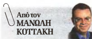
Από τον ΜΑΝΩΛΗ ΚΟΤΤΑΧΗ

ΟΙ ΣΧΕΣΕΙΣ δοκιμάζονται αυτόν τον καιρό, αλλά εμείς πολύ εύκολα προσπερνάμε ορισμένα γεγονότα ως « μεμονωμένα ». Αλήθεια, δεν προβληματίσε καθόλου το περιστατικό με τον υποψήφιο φοιτητή που μαχαίρωσε και σκότωσε τη μάνα του; Πόσα χρόνια είχαμε να ακούσουμε για μητροκτονία ; Το περιστατικό με τις αδελφές στη Νέα Μάκρη μήπως; Δεν είπε τίποτα σε κανέναν πόσο έχουν χαλαρώσει οι σχέσεις εμπιστοσύνης μέσα στο ίδιο σπίτι και πόσο συχνά είναι τα φαινόμενα προδοσίας ; Τα επανειλημμένα κρούσματα ξυλοδαρμού μέσα στα σπίτια; Οι συλλήψεις νεαρών βλαστών της καθωσπρέπει αθηναϊκής κοινωνίας για συμμετοχή σε τρομοκρατικές ομάδες; Αλήθεια, τι νομίζουν οι πολιτικοί αρχηγοί μας; Οτι όλα τα παραπάνω αποτελούν αποκλειστική αρμοδιότητα των ελα-