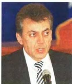
Πρεμιέρα με... το σύστημα να πέφτει, σερφάρισμα για... τόκους, επιδόματα, παγίδες και γκάφες!

Θ. Θεοχάρης: «Δεν θα δηλώνονται τόκοι κάτω των 250 ευρώ...»