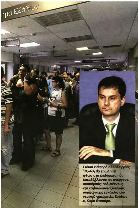
Ειδική εισφορά αλληλεγγύης 1%-4% θα επιβληθεί φέτος στα επιδόματα που καταβάλλονται σε ανέργους, αναπήρους, πολυτέκνους και χαμηλοσυνταξιούχους, σύμφωνα με εγκύκλιο του γενικού γραμματέα Εσόδων κ. Χρήση Θεοκάρη.