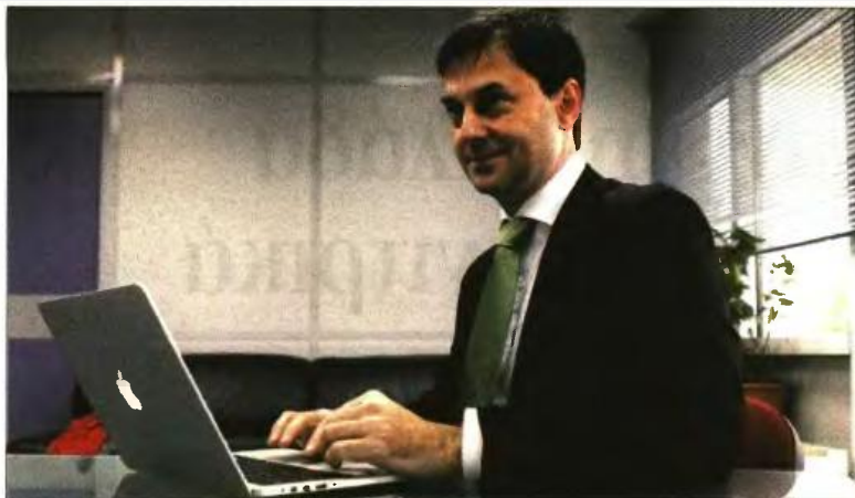
» Ο Χ. Θεοχάρης, γενικός γραμματέας Δημοσίων Εσόδων

Εισφορά αλληλεγγύης σε όλα τα εισοδήματα του 2012