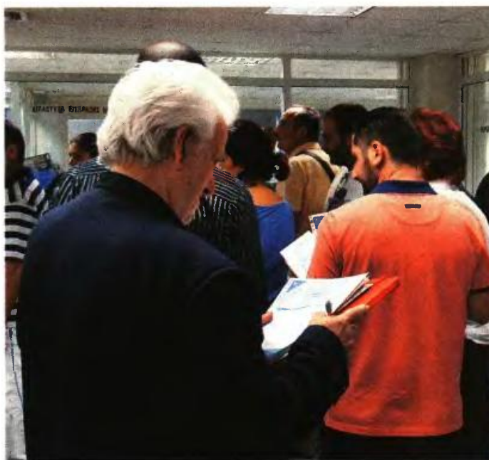
▲ ΜΕ ΕΙΣΦΟΡΑ αλληλεγγύης 1%-4% θα επιβαρυνθούν όλα τα εισοδήματα που απέκτησαν το 2012 οι φορολογούμενοι, ανεξάρτητα από το εάν αυτά απαλλάσσονται του φόρου ή φορολογούνται αυτοτελώς

β) Να μην έχει «πραγματικά εισοδήματα» (εισοδήματα από ενοίκια, ελευθέρια επαγγέλματα κλπ).