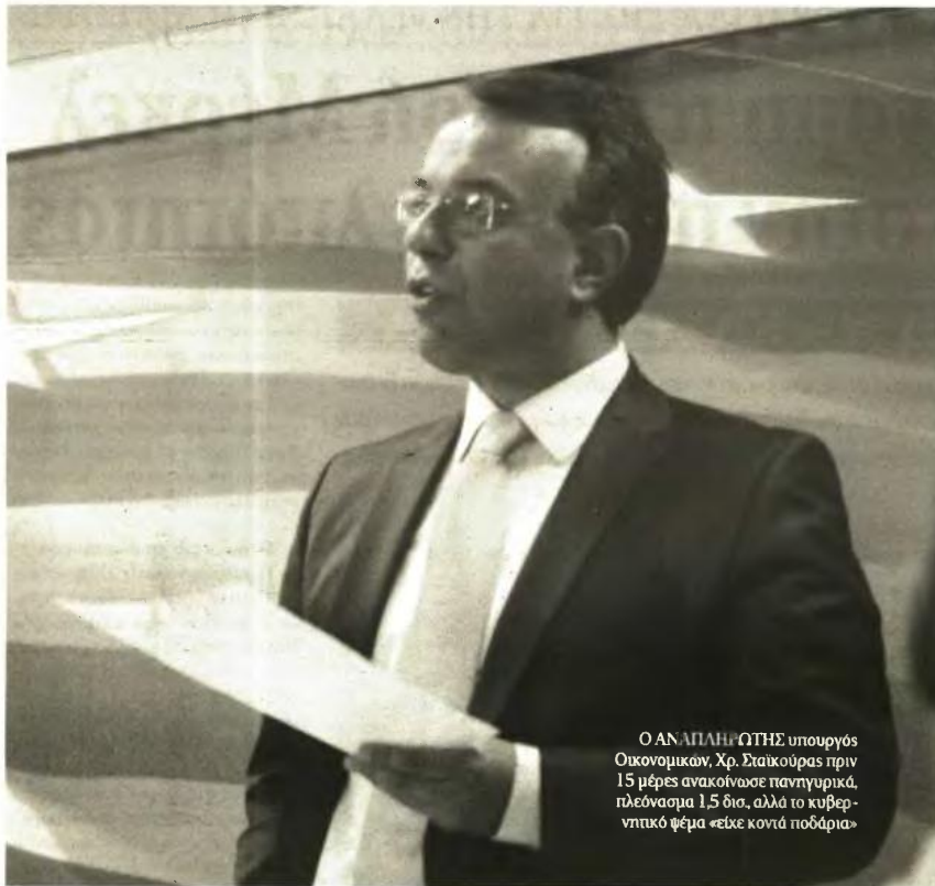
Ο ΑΝΑΠΛΗΡΩΤΗΣ υπουργός Οικονομικών, Χρ. Σταϊκούρας πριν 15 μέρες ανακοίνωσε πανηγυρικά, πλεόνασμα 1,5 δισ., αλλά το κυβερνητικό ψέμα «είχε κονιά ποδάρια»

Λιπομνεύει άλλο 1,5 δισ. περίπου. Όμως απ' αυτό το λιγγυιάδες πράγμα ποσό πρέπει να αφαιρεθούν: 1.306 δισ., τα οποία αντιστοιχούν σε κονδύλια του Προγράμματος Δημοσίων Επενδύσεων (ΠΔΕ), που έχουν εισηραχθεί από τα κοινοτικά ταμεία, αλλά δεν έχουν αποδοθεί στους δικαιούχους. Υπάρ-