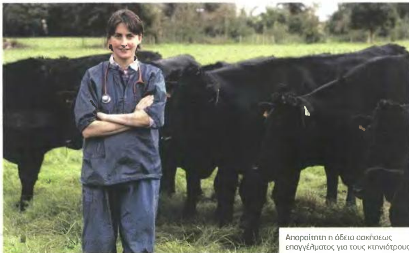
Απαραίτητη η άδεια ασκήσεως επαγγέλματος για τους κτηνιάτρους

Ζητούνται τεχνολόγοι ζωικής παραγωγής, κτηνίατροι και εργάτες - Τα προσόντα και τα δικαιολογητικά για την πρόσληψη