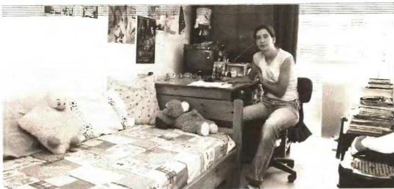
▲ ΜΕ ΤΗΝ ΕΙΣΟΔΟ στη φοιτητική εστία ο οικότροφος αποδέχεται τους όρους του εσωτερικού κανονισμού

Κατά τα λοιπά, σημειώνεται ότι στις εστίες υποβάλλουν αίτηση εισδοχής φοιτητές που πληρούν τις παρακάτω προϋποθέσεις: Έχουν την ιδιότητα του φοιτητή ανώτατης ή ανώτερης σχολής. Δεν είναι πτυχιούχοι άλλης ανώτατης ή ανώτερης σχολής. Οι οικογενειακές τους έχουν μόνιμο τόπο διαμονής διαφορετικό από αυτόν που βρίσκεται ο τόπος σπουδών και δεν διαθέτουν ιδιόκτητη κατοικία στην πόλη όπου βρίσκεται η εστία. Δεν έχουν συμπληρώσει τον 25ο χρόνο της ηλικίας τους. Οι οικότροφοι παραμένουν στις εστίες για όσα χρόνια σπουδών απαιτούνται κανονικά για