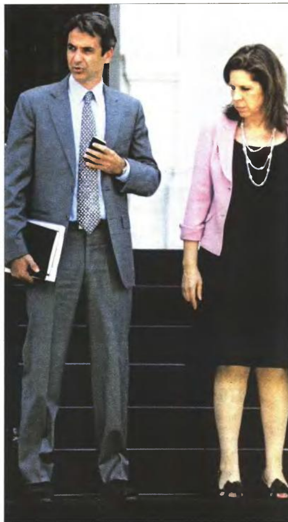
Ο υπουργός Διοικητικής Μεταρρύθμισης Κυριάκος Μπισσιτάκης με την υφυπουργό Εύη Χριστοφιλοπίδου

Υπενθυμίζεται ότι με εγκύκλιό του στα μέσα Αυγούστου το υπουργείο είχε διευκρινίσει ακόμα πέντε κατηγορίες δημοσίων υπαλλήλων που διασώζονται από τη διαθεσιμότητα (υπάλληλοι με ποσοστό αναπηρίας άνω του 67% και πολύτεκνοι, όσοι φροντίζουν εξαρτώμενα μέλη στην οικογένειά τους με αναπηρία άνω του 67%, μονογονεϊκές οικογένειες και όσοι έχουν οριστεί δικαστικοί συμπαραστάτες και έχουν χαμηλό εισόδημα. Εξαιρείται επίσης ο ένας σύζυγος στην περίπτωση που και οι δύο είναι δημόσιοι υπάλληλοι). Εν τω μεταξύ, δεν εξαιρούνται από την κινητικότητα δημόσιοι υπάλληλοι, πρώην διακριθέντες αθλητές.