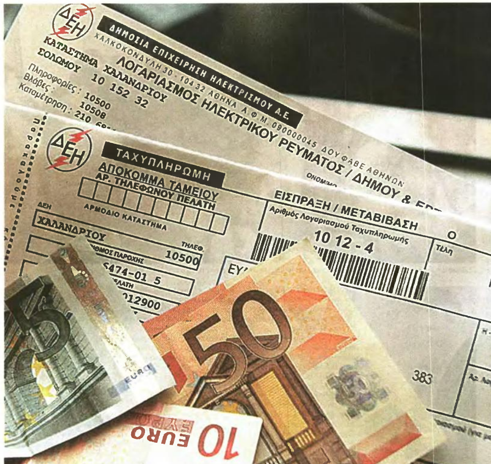
Χρήματα που δεν αφορούν την κατανάλωση του ηλεκτρικού ρεύματος καλούνται να πληρώνουν οι πολίτες μέσω των λογαριασμών της ΔΕΗ.

Σ τον λογαριασμό της ΔΕΗ τα νοικοκυριά και οι επιχειρήσεις πληρώνουν την αξία ηλεκτρικού ρεύματος που καταναλώνουν, αλλά και κάποιες άλλες χρεώσεις, που όμως η ΔΕΗ οφείλει να συνεισπράττει και να αποδίδει σε τρίτους. Ετσι, πέρα από την κατανάλωση ρεύματος που πληρώνουν οι καταναλωτές στη ΔΕΗ, στους λογαριασμούς περιλαμβάνονται και «χρεώσεις υπέρ τρίτων», οι οποίες υποχρεωτικά εισπράττονται από τη ΔΕΗ, με βάση σχετικούς νόμους. Συνολικά, τα νοικοκυριά πληρώνουν 14 χρεώσεις, εκ των οποίων οι επτά έχουν να κάνουν με την τμή του ρεύματος που «κάνει». Οι υπόλοιπες επτά προέρχονται από διαφορετικές πηγές, όπως το έκτακτο ειδικό τέλος ακινήτων, τα δημοτικά τέλη, η ΕΡΤ κ.λπ. Ας δούμε αναλυτικά τι πληρώνουμε: