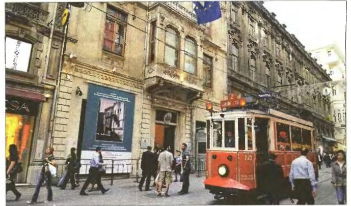
Το Σισμανόγλειο Μέγαρο του Γενικού Προξενείου της Ελλάδος στην Κωνσταντινούπολη

Κινητοποιήσεις από την Τρίτη θα κρατήσουν κλειστές τις γραμματείες