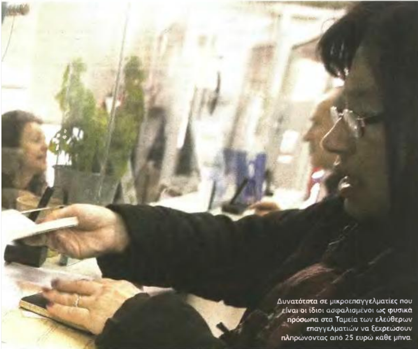
Δυνατότητα σε μικροεπαγγελματίες που είναι οι ίδιοι ασφαλισμένοι ως φυσικά πρόσωπα στα Ταμεία των ελευθέρων επαγγελματιών να ξεχρεώσουν πληρώνοντας από 25 ευρώ κάθε μήνα.

Κίνδυνος για κατασχέσεις. Σε ποσά άνω των 75.000 € θα απαιτεί υποθήκη περιουσιακών στοιχείων