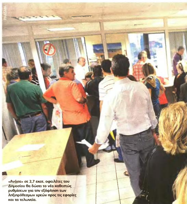
«Ανάσα» σε 2,7 εκατ. οφειλότες του Δημοσίου θα δώσει το νέο καθεστώς ρυθμίσεων για την εξόφληση των ληξιπρόθεσμων χρεών προς τις εφορίες και τα τελωνεία.

Με υψηλούς τόκους Ουσιαστικά, η ρύθμιση για τα χρέη που προέκυψαν μέχρι το τέλος του 2012 θα έχει τη μορφή μιας «τελευταίας ευκαιρίας» για όσους δεν έχουν