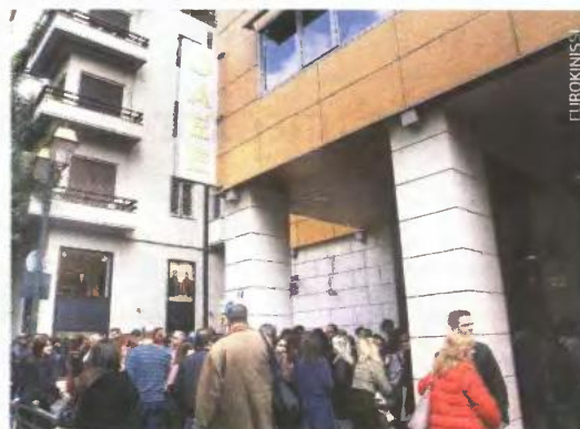
Οι αιτήσεις από εργοδότες, επιχειρήσεις και ελεύθερους επαγγελματίες για υπαγωγή στη ρύθμιση θα ξεκινήσουν στις αρχές Ιουνίου.

6 Οι επιχειρήσεις που είναι σε εκκαθάριση ή έχουν πτωχεύσει δεν θα εντάσσονται σε ρύθμιση.