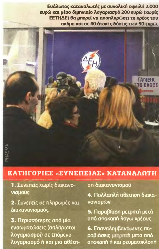
Ευάλωτος καταναλωτής με συνολική οφειλή 2.000 ευρώ και μέσο διμηνιαίο λογαριασμό 200 ευρώ (χωρίς ΕΕΤΗΔΕ) θα μπορεί να αποπληρώσει το χρέος του ακόμα και σε 40 άτοκες δόσεις των 50 ευρώ.

Κι αυτό για να αποσυμφορηθούν τα καταστήματα της ΔΕΗ, καθώς έχει διαπιστωθεί ότι ο κάθε διακανονισμός στα γκασέ της Επιχείρησης απαιτεί 5,5-7 λεπτά, με αποτέλεσμα να δημιουργούνται τεράστιες ουρές. ■