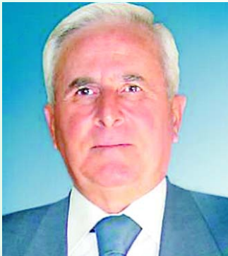
Του Βασίλη Θεοδοκιάτου Προέδρου της Ανωτάτης Συνομοσπονδίας Πολιτέκνων Ελλάδος (ΑΣΠΕ)

Τ ον Φεβρουάριο του 1993 δόθηκε στην δημοσιότητα το ομόφωνο πόρισμα της διακομματικής κοινοβουλευτικής επιτροπής «για τη μελέτη του δημογραφικού προβλήματος της χώρας και διατύπωση προτάσεων για την αποτελεσματική αντιμετώπιση του».