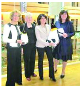
► Οι 4 Ευρωβουλευτές που κατέθεσαν την πρόταση για την ανακήρυξη του 2014

τικής περιοχής ως Ευρωπαϊκού έτους; Οι λόγοι είναι αρκετοί. Κατ' αρχήν, η θεματική περιοχή που θα επιλεγεί τυγχάνει ευρείας δημοσιότητας. Τα ΜΜΕ ασχολούνται με το θέμα, γίνεται συζήτηση στα κέντρα λήψεως των αποφάσεων και καλλιεργείται πρόσφορο έδαφος για την ανάληψη σχετικών με το θέμα πρωτοβουλιών σε νομοθετικό επίπεδο. Παράλληλα και εξ ίσου σημαντικό είναι το οικονομικό θέμα. Συνήθως, η ανακήρυξη ενός Ευρωπαϊκού έτους σημαίνει ότι θα υπάρχει δυνατότητα επιδοτήσεως δράσεων σχετικών με το αντικείμενο, όπου τα κονδύλια κατανέμονται στα κράτη - μέλη με βάση ορισμένα κριτήρια, αλλά και με την προϋπόθεση ότι το κράτος - μέλος θα χρηματοδοτήσει με ίσο προς την κοινοτική χρηματοδότηση ποσό τις δράσεις αυτές σε εθνικό επίπεδο. Το είδος των δράσεων που θα επιλεγούν προς χρηματοδότηση αποφασίζεται από το κάθε κράτος - μέλος ξεχωριστά. Προσδοκία μας λοιπόν είναι η επιτευχθεί ο στόχος, και το 2014 να συζητά όλη η Ευρώπη για την εξισορρόπηση εργάσιμης και οικογενειακής ζωής, και μέσα από τη συζήτηση αυτή να προκύψουν νομοθετήματα που θα κάνουν την Ευρώπη πιο ανθρώπινη, περισσότερο φιλική προς την οικογένεια.