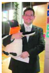
◀ Ευρωβουλευτής κρατώντας τον πιγκούνιο, το σύμβολο της προσπάθειας για το 2014