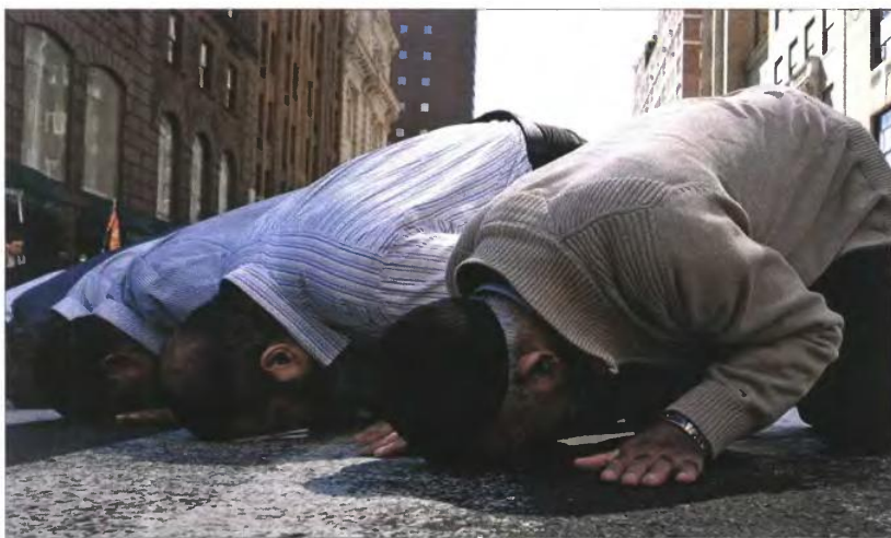
Μουσουλμάνοι κατά τη διάρκεια της προσευχής τους