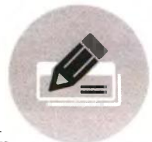
Στους αμειβόμενους με δελτίο παροχής υπηρεσιών το τέλος επιτηδεύματος παραμένει στα 500 ευρώ

Όσοι αμείβονται με μπλοκάκι, όμως, και θα φορολογηθούν ως μισθωτοί δεν μπορούν να αφαιρούν δαπάνες από το φορολογητέο εισόδημά τους, εκτός από τις ασφαλιστικές εισφορές. Για τους συγκεκριμένους εργαζόμενους, πάντως, το τέλος επιτηδεύματος παραμένει στα 500 ευρώ.