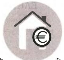
Η φορολόγηση των εισοδημάτων από ενοίκια είναι πλέον αυτοτελής με διαχωριστική γραμμή για τους συντελεστές τα 12.000 ευρώ

Χαμένοι από το νέο σύστημα των ενοικίων είναι οι ιδιοκτήτες ακινήτων που δεν έχουν άλλα εισοδήματα, αφού χάνουν το αφορολόγητο των 5.000 και στο εξής θα φορολογούνται από το πρώτο ευρώ. Για παράδειγμα, φορολογούμενος που είχε το 2012 αποκλειστικό εισόδημα από ενοίκια 10.000 ευρώ τον χρόνο, όφειλε φόρο 500 ευρώ (τα πρώτα 5.000 ευρώ ήταν αφορολόγητα και τα επόμενα 5.000 φορολογούνταν με συντελεστή 10%). Με τις αλλαγές, στα 10.000 ευρώ εισοδήματος από ενοίκια επιβάλλεται συντελεστής 10% και ο φόρος διαμορφώνεται σε 1.000 ευρώ.