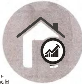
Επιβάλλεται στη διαφορά μεταξύ της τιμής πώλησης και της τιμής κτήσης

γ) Το κέρδος μέχρι 25.000 ευρώ που πραγματοποιείται από μεταβίβαση ακινήτου και εφόσον το ακίνητο αυτό έχει διακρατηθεί για διάστημα τουλάχιστον 5 ετών. Η εξίχναιση δεν ισχύει για φυσικά πρόσωπα, τα οποία πραγματοποιούν πέραν της μίας μεταβίβασης εντός της πενταετίας.