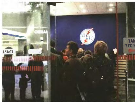
>> Ουρές σχημάτισαν 1,1 εκατομμύρια πολίτες στην Εταιρεία Ηλεκτρισμού για να διακανονίσουν τα χρέη τους προς αυτή.

Συνολικά, δηλαδή, τη διετία 2011-12 οι διακανονισμοί της ΔΕΗ για τη διευκόλυνση των πελατών που αντιμετωπίζουν οικονομικά προβλήματα αθροιστικά υπολογίζονται σε πάνω από 1,1 εκατομμύρια περιπτώσεις και, αν συνυπολογιστεί ότι οι μέσοι καταναλωτές είναι περίπου 2,5 εκατομμύρια, αυτό σημαίνει ότι ένας στους δύο δεν μπορούσε να πληρώσει τον λογαριασμό του ρεύματος. Το έγγραφο του κ. Ζερβού διαβιβάστηκε στη Βουλή μετά από ερώτηση του βουλευτή της ΔΗΜΑΡ Β. Οικονόμου για τα κοινωνικά τιμολόγια. Εκεί μεταξύ άλλων ο πρόεδρος και διευθύνων σύμβουλος της ΔΕΗ υπενθυμίζει ότι η επιχείρηση έχει προτείνει στην πο-