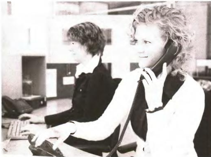
Ο προγραμματισμός θα βασιστεί στην αναλογία 1 πρόσληψη για κάθε 5 αποχωρήσεις