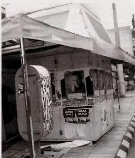
Στη Λαμία, ένα στα δύο περίπτερα έχει κλείσει, ενώ τα εγκαταλελειμμένα αποτελούν πλέον εστιακές ρύπανση, εκπέμποντας μια εικόνα αισθητικής παρακμής.