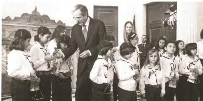
Ο Πρωθυπουργός με τα παιδιά του Σώματος Ελληνικού Οδηγισμού που του έψαλαν προχθές τα κάλαντα

για να ερευνηθεί αυτή η σκευωρία». Ο πρώην υπουργός προσθέτει ότι η πρόταση παραπομπής του σε προανακριτική επιτροπή «βρίθει ανακριβειών» και τον θεωρεί «εκ προοιμίου ένοχο» για αλλοίωση της λίστας που «δεν είχε κανένα κίνητρο να κάνει». «Δεν έχω τίποτα να κρύψω και δεν θα γίνω η πρόθυμη Ιφιγένεια κανενός» κατέληξε.