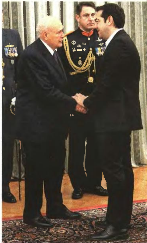
Ο Κάρλος Παπούλιας υποδέχεται τον επικεφαλής του ΣΥΡΙΖΑ χθες στο Προεδρικό Μέγαρο

Σε κάθε περίπτωση πάντως, όπως τονίζεται από στενούς συνεργάτες