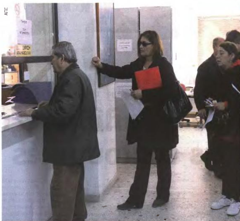
Οι αποφάσεις του υπ. Οικονομικών αναμένεται να προκαλέσουν κάμψη στα φορολογικά έσοδα με συνέπεια η Τρόικα να ζητήσει την επιβολή νέων μέτρων.

1 Η απαλλαγή από την υποχρέωση τήρησης βιβλίων και έκδοσης τιμολογίων και αποδείξεων των περισσότερων επιχειρήσεων παροχής υπηρεσιών με ετήσια ακα-