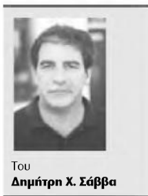
Του Δημήτρη Χ. Σάββα

“Τα πολλά παιδιά είναι ευτυχία, χαρά, ευλογία” έλεγαν οι παλιότεροι. “Ένα παιδί ίσον κανένα” και τόσα άλλα πολλά, πραγματικά, από τη ζωή βγαλμένα. Ευτυχημένοι λοιπόν οι πολύτεκνοι γονείς, αρκεί να έβλεπαν τα παιδιά τους χαρούμενα κι ευτυχισμένα, χωρίς στερήσεις, χωρίς στενοχώριες, αρκεί οι ίδιοι να μπορούσαν να τους προσφέρουν τα αναγκαία. Παλιότερα υπήρχαν αρκετοί πολύτεκνοι. Στις μέρες μας λιγοστεύουν. Σκέφτονται οι άνθρωποι πως τα πολλά παιδιά δημιουργούν ανάλογες υποχρεώσεις.