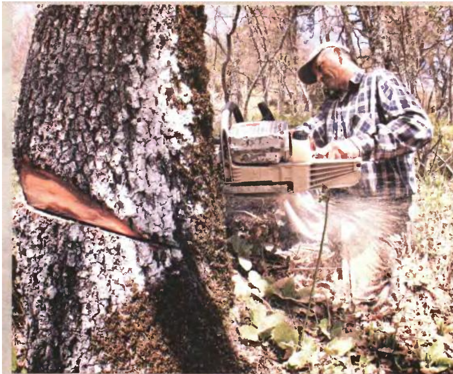
Πρόγραμμα εκτέλεσης υλοτομιών υπό την επίβλεψη της Δασικής Υπηρεσίας σε καθορισμένες περιοχές εξήγγειλε το ΥΠΕΚΑ, με σκοπό να πατάξει τη λαθρουλοτομία