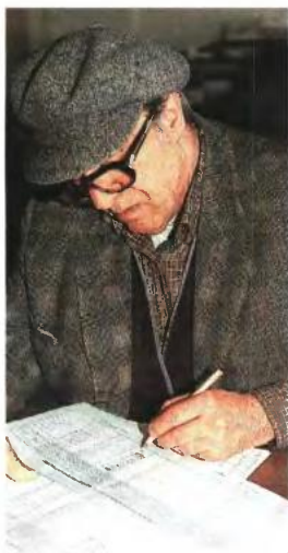
▲ ΤΑ «ΤΣΟΥΧΤΕΡΑ» τεκμήρια διαβίωσης απειλούν χαμηλόμισθους και χαμηλοσυνταξιούχους που διαμένουν σε ιδιόκτητη ή μισθωμένη κατοικία