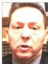
Ο Ι. Στουρνάρας

ΤΟ ΦΑΙΝΟΜΕΝΟ της πολιτικής Στουρνάρα στον τομέα της άμυνας δεν εκπλήσσει, δεδομένου ότι αυτή εντάσσεται στην πνευματική και ιδεολογική παράδοση του τέως πολιτικού του προϊστάμενου Κ. Σημίτη. Υπενθυμίζεται ότι ο πρώην πρωθυπουργός, προ της δραματικής του εμπειρίας στα Ιμια (μετά την οποία υλοποίησε το μεγαλύτερο εξοπλιστικό πρόγραμμα της χώρας), ήταν αυτός που -επί πρωθυπουργίας Ανδρέα Παπανδρέου- εισηγάγε την επικίνδυνη διαφοροποίηση της μη ψυχροποίησης των αμυντικών δαπανών κατά τη διαδικασία εγκρίσεως του προϋπολογισμού της εποχής. Θα ήταν τουλάχιστον ανήκουστο να χρειάζεται κάθε φορά μια επανάληψη τέτοιων άκρας δυσμενών για τη χώρα καταστάσεων (τότε τα Ιμια, στο μέλλον η ΑΟΖ;)