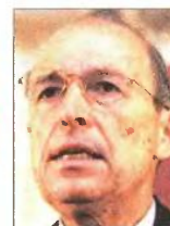
Ο Κ. Σημίτης

για τη θεραπεία των συνεπειών της πολιτικής τύπου Σημίτη και Στουρνάρα. Ιδίως, μάλιστα, σε μια περίοδο όπου ο τότε από μηχανής (Αμερικανός) θεός δεν είναι σίγουρο ότι θα υπάρξει ξανά, λόγω της ενασολογίας του με άλλα σοβαρότερα σήμερα προβλήματα. Γιατί αυτή η επανάληψη θεμάτων που έχουν αναφερθεί ξανά από την «κυριακάτικη δημοκρατία»; Γιατί στην πρόσφατη συνέντευξή του στον Α. Παπακλά ακούσαμε τον Γ. Στουρνάρα να λέει ότι σε περίπτωση που δεν επτευχθούν οι τε-