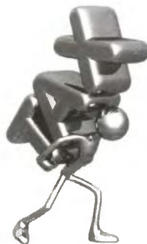
ΤΟΥ ΓΙΩΡΓΟΥ ΚΟΥΤΣΟΥΚΟΥ*