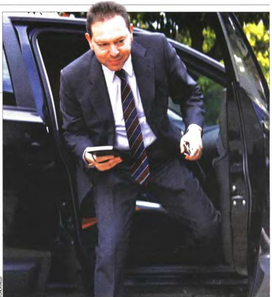
▲ Ο υπουργός Οικονομικών Γιάννης Στουρνάρας βγαίνει από το αυτοκίνητό του έξω από το Μέγαρο Μαξίμου