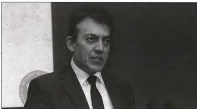
Επί τάπητος τέθηκε η οριστικοποίηση των παραμέτρων (όρων και προϋποθέσεων) των νέων προγραμμάτων στο πλαίσιο του Εθνικού Συμφώνου Δράσης για την απασχόληση χιλιάδων νέων

Με νομοθετική ρύθμιση επανερχονται ο κοινωνικός τουρισμός και η επιδότηση ενοικίου - επιτοκίου