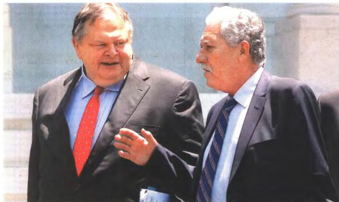
▲ ΔΙΕΞΟΔΙΚΗ ΣΥΖΗΤΗΣΗ για το φορολογικό νομοσχέδιο ζήτησαν, κατά τη συνάντηση των τριών πολιτικών αρχηγών, Βενιζέλος και Κουβέλης

Ενστάσεις από Βενιζέλο και Κουβέλη για το νομοσχέδιο