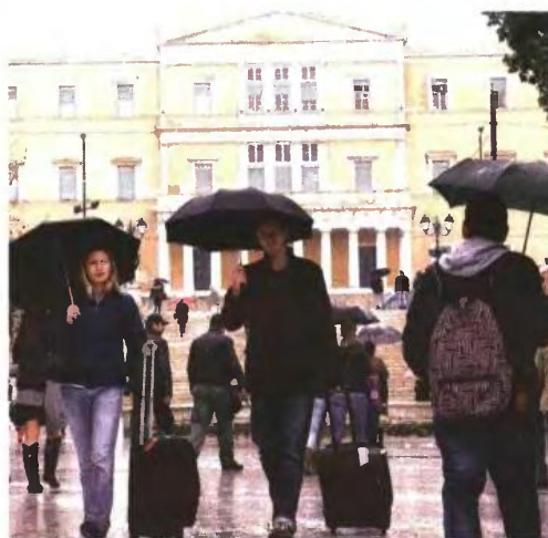
Δυστυχώς, στο στόχαστρο του νέου φορολογικού πλαισίου μπαίνουν οι οικογένειες