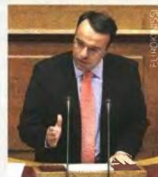
► ΧΡΗΣΤΟΣ ΣΤΑΪΚΟΥΡΑΣ