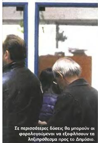
Σε περισσότερες δόσεις θα μπορούν οι φορολογούμενοι να εξοφλήσουν τα ληξιπρόθεσμα προς το Δημόσιο.