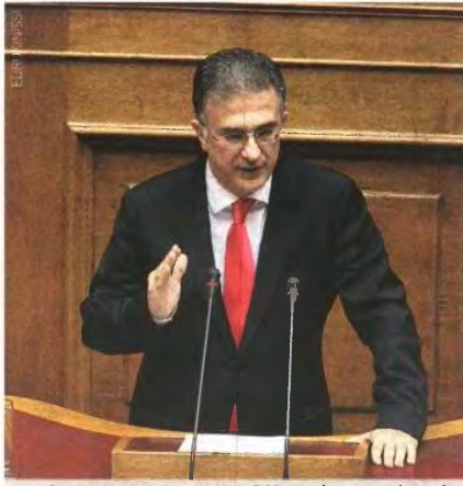
Ο υφυπουργός Οικονομικών, κ. Γ. Μαυραγάνης, ανακοίνωσε ότι εξετάζονται τρόποι για τη βελτίωση της υφιστάμενης ρύθμισης.

Τ η θέπιση ευνοϊκότερου νομοθετικού πλαισίου για την τμηματική εξόφληση ληξιπρόθεσμων οφειλών προς το Δημόσιο προανήγγειλε χθες η πολιτική ηγεσία του υπουργείου Οικονομικών. Στόχος του υπουργείου είναι να αρχίσει σταδιακά να μειώνεται το αστρονομικό ποσό των 54 δια. ευρώ στο οποίο έχουν φθάσει μέχρι στιγμής τα ληξιπρόθεσμα χρέη προς το Δημόσιο. Οι νέες νομοθετικές ρυθμίσεις που προωθούνται θα παρέχουν τη δυνατότητα στους φορολογούμενους που οφείλουν στο Δημόσιο να εξοφλήσουν