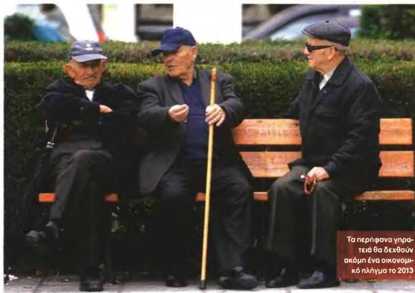
Τα περήφανα γηρατειά θα δεχθούν ακόμη ένα οικονομικό πλήγμα το 2013