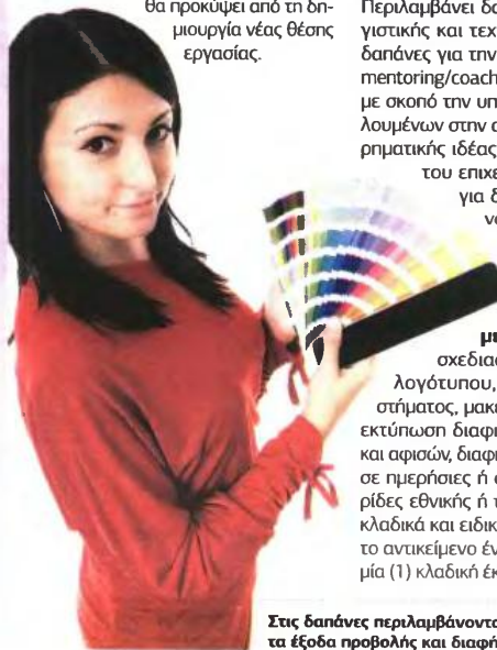
Στις δαπάνες περιλαμβάνονται τα έξοδα προβολής και διαφήμισης.

Περιλαμβάνονται λογαριασμοί ηλεκτρισμού, ύδρευσης, θέρμανσης, σταθερής τηλεφωνίας, κινητής τηλεφωνίας, Διαδικτύου