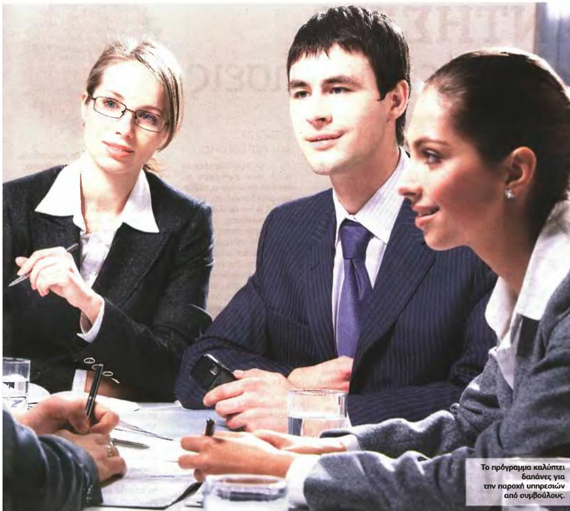
Το πρόγραμμα καλύπτει δαπάνες για την παροχή υπηρεσιών από συμβούλους.