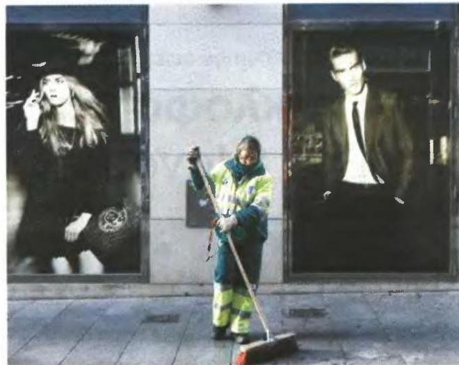
Με την είσοδο του νέου έτους, αυξάνονται τα ανώτατα όρια ηλικίας για συνταξιοδότηση από τα 65 στα 67 έτη και από τα 60 στα 62 έτη (το κατώτατο όριο ηλικίας συνταξιοδότησης με τη συμπλήρωση 40 ετών ασφάλισης).

Ακόμη, θεσπίζεται ανώτατο όριο στη σύνταξη που καταβάλλεται στις άγαμες θυγατέρες θανόντων συνταξιούχων του δημοσίου, το οποίο ανέρχεται στα 720 ευρώ μηνιαίως, ενώ προβλέπονται εισοδηματικά κριτήρια για την καταβολή της συγκεκριμένης σύνταξης. Αλλαγές θα υπάρξουν και στο ύψος των εφάπαξ, τα οποία περικλύονται έως 83%, σε 20 τομείς πρόνοιας που παρουσίασαν ελλείμματα. Το μέτρο αφορά όσους υπέβαλαν αίτηση χορήγησης εφάπαξ από την 1η Αυγούστου 2010 και μετά.