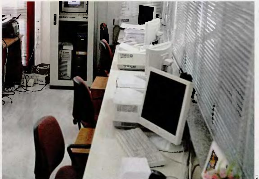
Μέχρι στιγμής έχουν διαπιστωθεί 7.500 κενές θέσεις στο Δημόσιο, οι οποίες αναμένεται να καλυφθούν άμεσα.

Ως προς τους φορείς που έχουν πλεονάζον προσωπικό και θα αποτελέσουν τη «δεξαμενή» για την κάλυψη των κενών θέσεων, εντός 20 ημερών από την ανακοίνωση του υπουργείου, θα πρέπει να καταρτίσουν τους πίνακες των υπαλλήλων προς μετακίνηση, καθώς και τη σειρά προτεραιότητας με την οποία εκείνοι έχουν δηλώσει την προτίμησή τους για τη νέα υπηρεσία. Εάν για κάποιο λόγο, υπάλληλοι