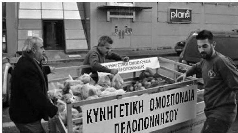
Το πακέτο τροφίμων περιελάμβανε τρία με τέσσερα κιλά κρέας αγριόχοιρου, 5 κιλά λάδι, ζυμαρικά και φρούτα.

αλλά και την ψυχική ανάταση που σήμερα στις μέρες μας την χρειαζόμαστε περισσότερο από ποτέ", δήλωσε ο πρόεδρος της Κυνηγετικής Ομοσπονδίας Πελοποννήσου κ. Κωνσταντίνος Μαρκόπουλος, ευχαριστώντας παράλληλα τους κυνηγούς που συνέδραμαν την όλη