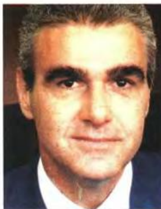
▲ Ο υφυπουργός Ενέργειας Ασημάκης Παπαγεωργίου

ριών παροχής ηλεκτρικού ρεύματος. Μόνο από το διογκωμένο κόστος που θα έχει η ΔΕΗ από 1/1/2013 εξαιτίας της υποχρέωσης αγοράς δικαιωμάτων εκπομπής ρύπων για το σύνολο του διοξειδίου του άνθρακα που παράγει προκύπτει σοβαρή επιβάρυνση που θα μετακυλιθεί στους καταναλωτές. Η διοίκηση της ΔΕΗ έχει ξεκαθαρίσει ότι η πλήρης απελευθέρωση των τιμολογίων είναι η μοναδική σανίδα σωτηρίας για την επιχείρηση που αντιμετωπίζει σοβαρά προβλήματα ρευστότητας. Η τρόικα πιστεύει ότι η απελευθέρωση θα επιτρέψει να μπουν στην αγορά και άλλοι «παίκτες», με την ελπίδα πως θα αποδειχθούν σοβαρότεροι των Hellas Power και Energa (οι υπεύθυνοι των οποίων φυλακίστηκαν πρόσφατα).