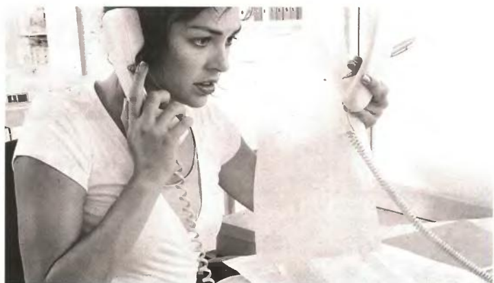
Η αύξηση των αιτήσεων συνταξιοδότησης έχει άμεσες επιπτώσεις στα οικονομικά των φορέων, καθώς μειώνονται τα έσοδα από εισφορές και αυξάνονται τα έξοδα για την καταβολή συντάξεων

Ουσιαστικά πρόκειται για το... έτος της μεγάλης φυγής, καθώς από την επόμενη χρονιά αυξάνονται τα όρια ηλικίας στα ασφαλιστικά ταμεία και δυσκολεύεται η εξόδος στη σύνταξη. Εκτιμάται πως 100.000 άτομα που δεν θα προλάβουν να θεμελιώσουν δικαίωμα θα «παγιευτούν» τη διετία 2013-2014 στην αγορά εργασίας εξαιτίας των αλλαγών