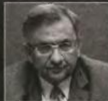
Ο Δ.Σ. της ΕΤΕ, ΑΛ, Τουρκολίας