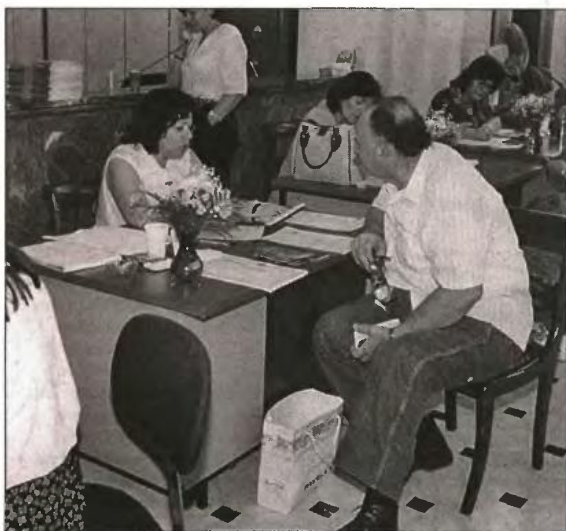
Ανώτατο όριο επιτοκίων των πιστωτικών καρτών και κατάργηση πανωτοκίων ζητάει η ΟΤΟΕ

της δόσης που προκύπτει υπερβαίνει το 30% σε μηνιαία βάση, το επιπλέον μέρος του τόκου που δεν καταβάλλεται, θα διαγράφεται. Παράλληλα, στο τέλος της περιόδου χάριτος θα επανεξετάζεται η οικονομική κατάσταση του οφειλέτη. Σε περίπτωση που δεν έχει βελτωθεί, θα παρέχεται η δυνατότητα παράτασης των ευνοϊκών όρων αποπληρωμής για τα επόμενα 2 έτη, υπό την προϋπόθεση ότι η συνολική διάρκεια του δανείου δεν θα ξεπερνά τα 40 χρόνια. Στο πλαίσιο αυτό ανακούφισης των δανειοληπτών φαίνεται ότι θα υπάρχει ειδική μέριμνα για όσους το μηνιαίο εισόδημα δεν ξεπερνά τα 500 ευρώ για 6 συνεχείς μήνες. Τότε, θα παρέχεται 2ετής περίοδος χάριτος χωρίς καμία κατα-