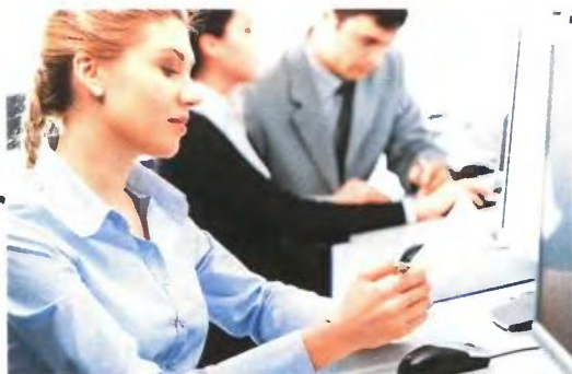
▲ ΜΕΤΑΞΥ ΤΩΝ ΚΕΡΔΙΣΜΕΝΩΝ περιλαμβάνονται μισθωτοί και συνταξιούχοι με χαμηλά εισοδήματα, νέοι επαγγελματίες αλλά και μεγάλες εταιρείες (ΑΕ και ΕΠΕ)