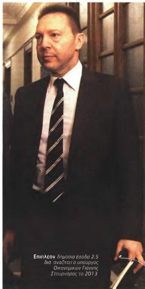
Επιπλέον δημοσία εσοδα 2,5 δισ αναζητεί ο υπουργός Οικονομικών Γιάννης Στουρνάρας το 2013

Ως βασικό επικριτήριο για την κατάργηση του αφορολόγητου ορίου για τα παιδιά, το οικονομικό επιτελείο έθεσε το γεγονός ότι για πρώτη φορά θα δοθεί επίδομα στις οικογένειες με 1 παιδί και 2 παιδιά, περίπου 1.100.000, με εισοδηματικά κριτήρια που καλύπτουν περίπου το 70% των περιπτώσεων. Με αυτόν τον τρόπο, όπως υποστηρίζουν αρμόδια στελέχη του υπουργείου Οικονομικών, μπορεί από την εφαρμογή του μέτρου να φανεί ότι προκύπτει επιβάρυνση για τις οικογένειες, όμως εάν γίνει ο υπολογισμός και με βάση το νέο επίδομα που θα δοθεί, τότε θα διαπιστωθεί ότι οικογένειες με ένα ή και δύο παιδιά θα έχουν ελάφρυνση. Ωστόσο θα πρέπει να εξεταστεί το ύψος του εισοδηματικού κριτηρίου, καθώς ενδέχεται με βάση το οικογενειακό εισόδημα πολλές οικογένειες να χάσουν ακόμη κι αυτό το πρόσθετο επίδομα. [SID:7124300]