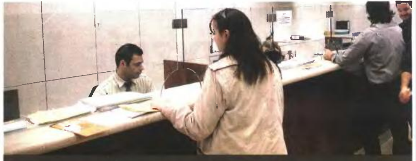
ΤΟ ΜΠΡΑΝΤΕ ΦΕΡ ΓΙΑ ΤΗ ΡΥΘΜΙΣΗ

Οι ελληνικές τράπεζες, αν και δεν τάσσονται υπέρ μιας οριζόντιας ρύθμισης, θεωρούν ότι το κόστος των περίπου 300 εκατ. ευρώ κατ' έτος από τη ρύθμιση είναι διαχειρίσιμο. Αναγνωρίζουν, δε, ότι μπορεί να αποτελέσει μια διέξοδο για την αύξηση των επισφαλειών, καθώς αυτά τα δάνεια θα πάψουν να θεωρούνται προβληματικά και θα μπει σε διαδικασία αποπληρωμής.