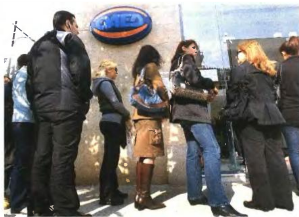
Στην περίπτωση που κάποια επιχείρηση προσλάβει άνεργους που είναι γραμμένοι στον ΟΑΕΔ και ανήκουν στις ειδικές ομάδες, όπως άνεργοι που βρίσκονται στο στάδιο πλησίον της σύνταξης, γυναίκες μακροχρόνια άνεργες, νέοι έως 30 ετών, τότε θα επιχορηγείται για δύο χρόνια με το 80% των μηνιαίων ασφαλιστικών εισφορών

Για να υπαχθεί μία επιχείρηση στο πρόγραμμα δεν θα πρέπει να έχει προβεί, κατά τη διάρκεια του εξαμήνου πριν από την αίτηση υπαγωγής της στο πρόγραμμα, σε μείωση προσωπικού