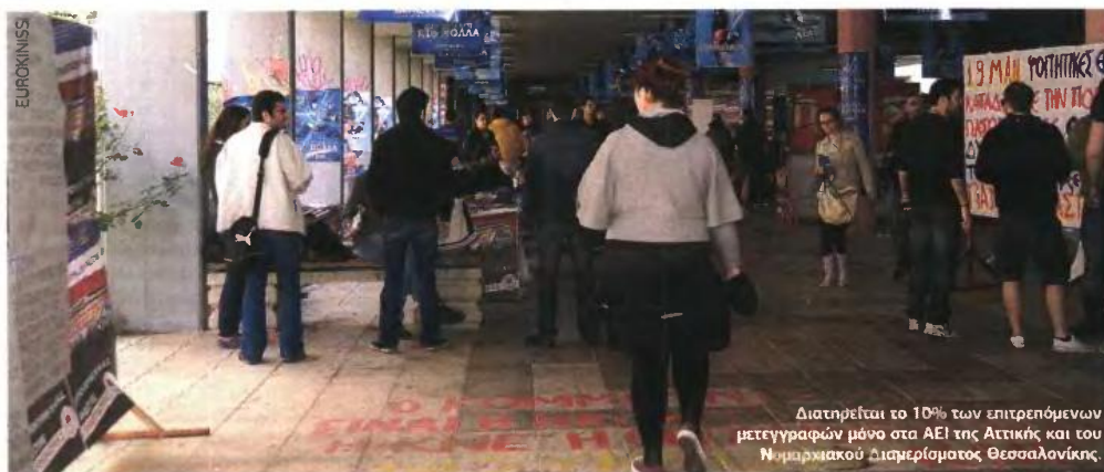
Διατηρείται το 10% των επιτρεπόμενων μετεγγραφών μόνο στα ΑΕΙ της Αττικής και του Νομαρχιακού Διαμερίσματος Θεσσαλονίκης.

ΕΥΝΟΪΚΑ ΚΡΙΤΗΡΙΑ ΓΙΑ ΟΙΚΟΓΕΝΕΙΕΣ ΠΟΛΥΤΕΚΝΩΝ