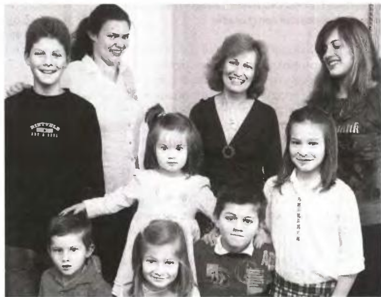
▲ ΤΟ ΕΠΙΔΟΜΑ θα δοθεί στους πολύτεκνους σε τρεις δόσεις, ενώ οι δικαιούχοι θα πρέπει να υποβάλουν αίτηση

■ Εξαρτώμενα νοούνται τέκνα προερχόμενα από γάμο, εφόσον είναι άγαμα και δεν υπερβαίνουν το 18ο έτος της ηλικίας τους ή το 19ο έτος, εφόσον φοιτούν στη μέση εκπαίδευση. Ειδικά για τα τέκνα που φοιτούν στην ανώτερη ή ανώτατη εκπαίδευση