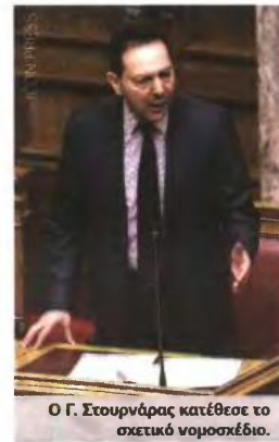
Ο Γ. Στουρνάρας κατέθεσε το σχετικό νομοσχέδιο.

5 Καταργείται η υποχρέωση του Δημοσίου να ελέγχει όλες τις φορολογικές υποθέσεις που παραμένουν εκκρεμείς σε βάθος 10ετίας. Οι φοροελεγκτικές υπηρεσίες του υπουργείου Οικονομικών θα επιλέγουν για έλεγχο φορολογικές υποθέσεις συγκεκριμένων ετών