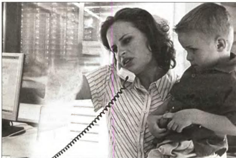
Μέσα στον Απρίλιο θα εκδοθεί κοινή απόφαση των υπουργών Οικονομικών και Εργασίας, Κοινωνικής Ασφάλισης και Πρόνοιας, σύμφωνα με την οποία θα ρυθμιστούν τα δικαιολογητικά που απαιτούνται για την απόδειξη της 10ετούς κατοικίας ή διαμονής στην Ελλάδα, η διαδικασία χορήγησης του επιδόματος και ο φορέας καταβολής του

Ορίζεται σε 500 ευρώ κατ' έτος για κάθε τέκνο, εφόσον το οικογενειακό φορολογητέο εισόδημα είναι μέχρι 45.000 ευρώ για τις τρίτεκνες οικογένειες