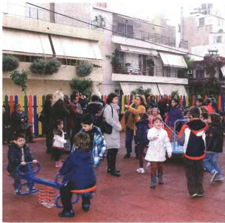
Το επίδομα θα χορηγείται κατόπιν αίτησης και θα καταβάλλεται σε τρεις δόσεις