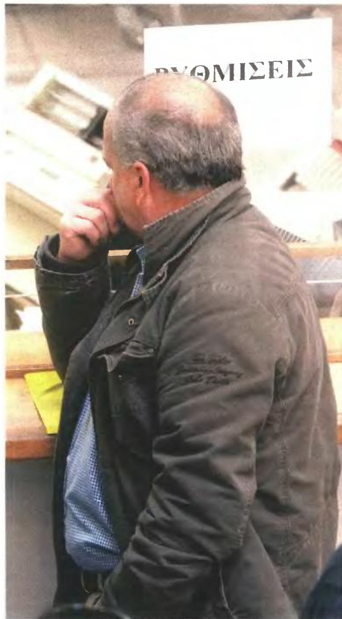
Αντιμέτωποι με μέτρα αναγκαστικής είσπραξης κινδυνεύουν να βρεθούν όσοι δεν ρυθμίσουν τις οφειλές τους προς το Δημόσιο

3 Για ελευθερούς επαγγελματίες και επιτηδευματίες που δεν πληρώνουν το Δημόσιο, δίνονται εντολές για κατασχέσεις αμοιβών από τους πελάτες τους,