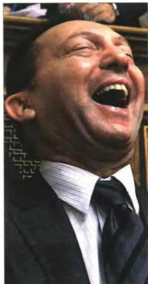
Ο υπουργός Οικονομικών Γιάννης Στουρνάρας

Μεγάλοι χαμένοι στο μέτωπο της μηνιαίας παρακράτησης είναι οι οικογενειάρχες, οι οποίοι μετά την κατάρ-