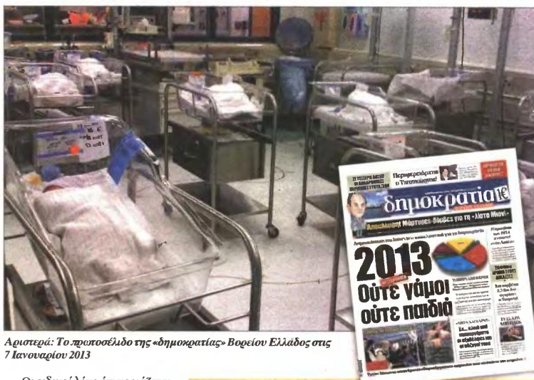
Αριστερά: Το προποσέλλο της «δημοκρατίας» Βορείου Ελλάδος στις 7 Ιανουαρίου 2013

Δραματικά τα στοιχεία για τη μείωση των ζευγαριών που τεκνοποιούν τα τελευταία χρόνια (των περικοπών). Στη χειρότερη θέση ο Νότος, με «πρωταθλήτρια» την Ελλάδα (των εκτρώσεων και των αποβολών)