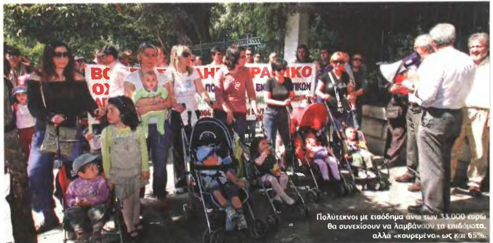
Πολύτεκνοι με εισόδημα άνω των 33.000 ευρώ θα συνεχίσουν να λαμβάνουν τα επιδόματα, αλλά «κουρευμένα» ως και 65%.

Κερδισμένοι οι χαμηλόμισθοι, χαμένοι οι τρίτεκνοι και πολύτεκνοι. Η διαδικασία, οι δικαιούχοι και τα ποσά